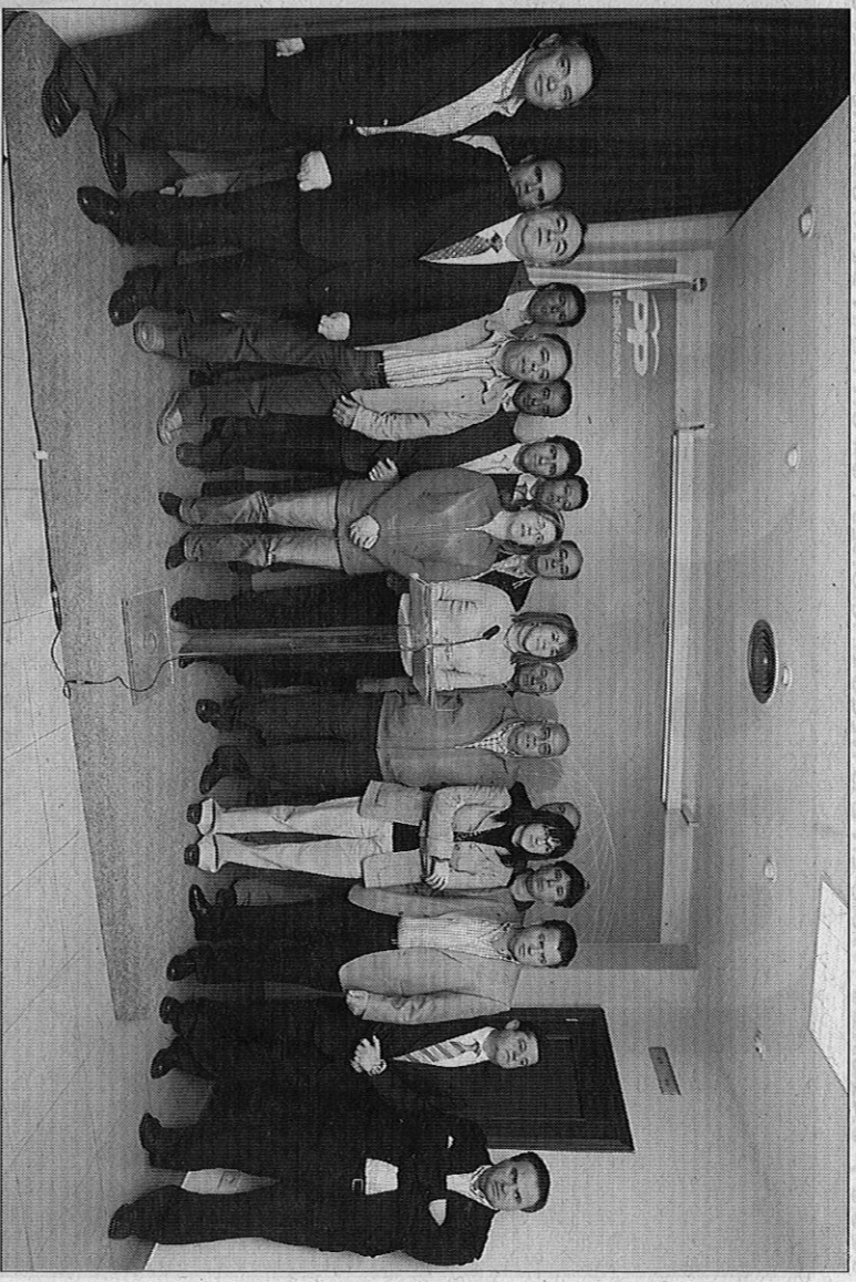
La presidenta regional perfila algunas de sus propuestas con los candidatos a la Alcaldía de los municipios sagreños.