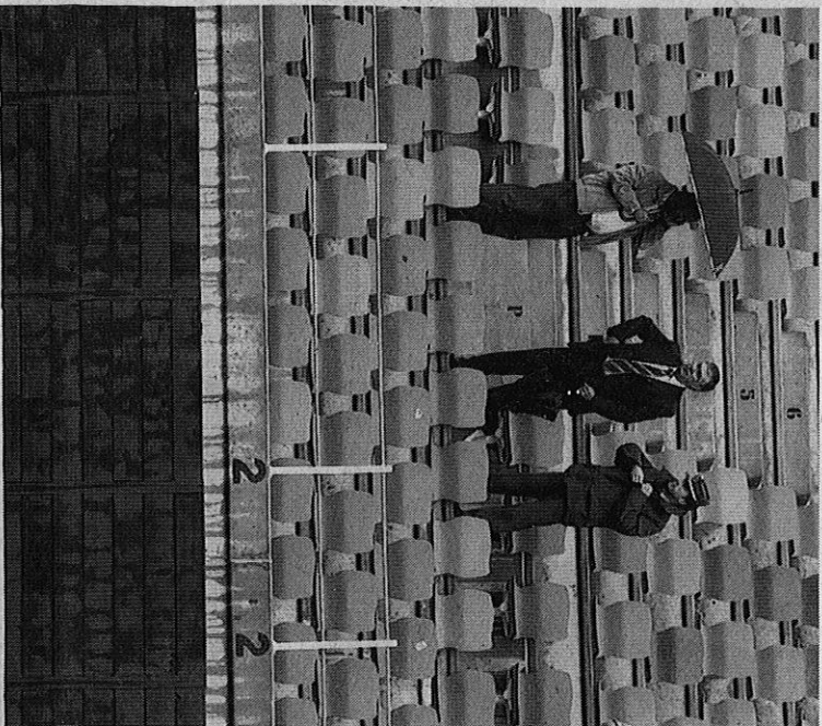
Tofiño, ayer cuando tomó la decisión de suspender los festejos