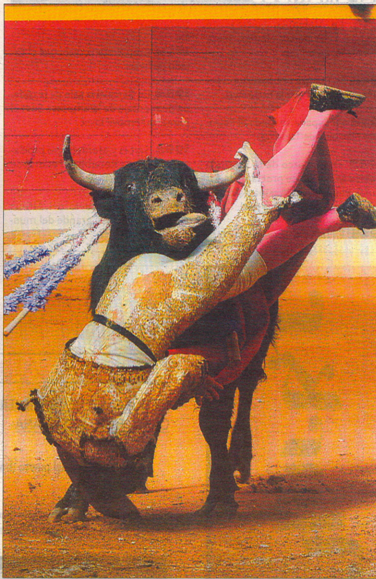
Merín fue cogido por el primero de forma dramática.

No obstante, el novillero se puso en contacto con quien les redacta la crónica para manifestar tras el festejo que pedía perdón por los actos ofensivos que había tenido hacia los aficionados. Ahí queda Luis tu perdón, y aquí nos hacemos eco de ello para que se lea.