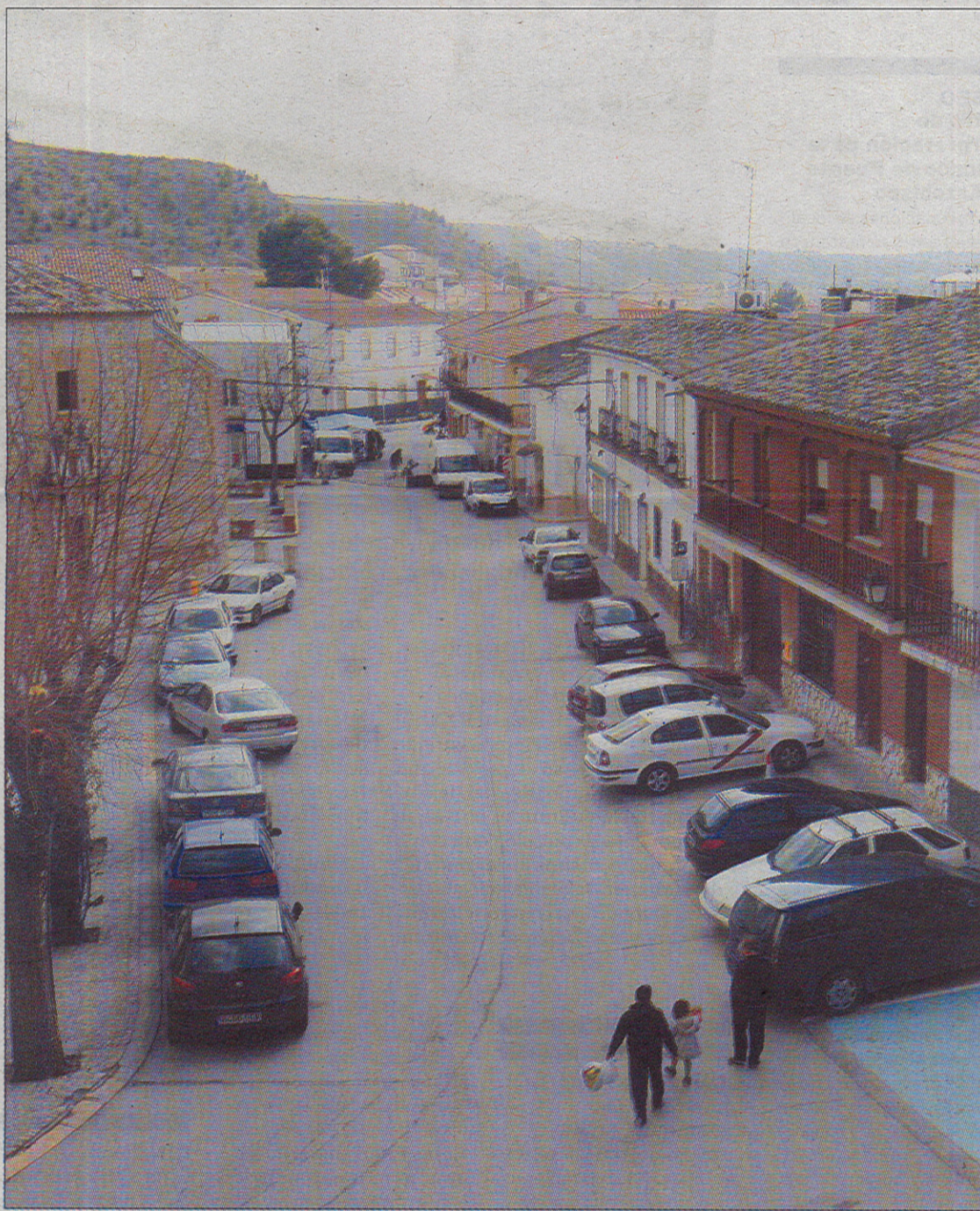
El principal criterio de adjudicación será la oferta económica.

El crecimiento que propone el Plan de Ordenación en información pública resulta más coherente que el anterior y se basa en las