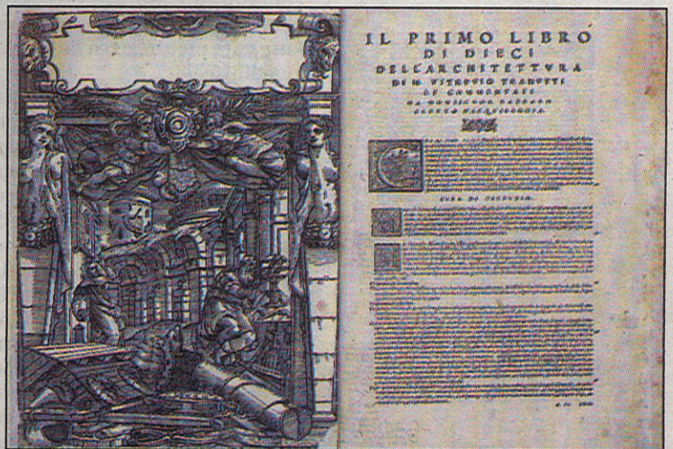
Algunos de los libros de la biblioteca personal de El Greco.