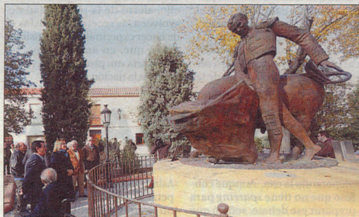
La líder del PP contempla el monumento al torero local Domingo Ortega.

candidatura, Arturo García-Tizón. Este veterano político siempre ha insistido que el PSOE y Ciudadanos siempre sumaron sus escaños para descabalarle del poder a Podemos. Sin embargo, aquella tercera fuerza que echó a los 'populares' del Gobierno provincial es otra, Izquierda Unida, con similitudes ideológicas con la forma-