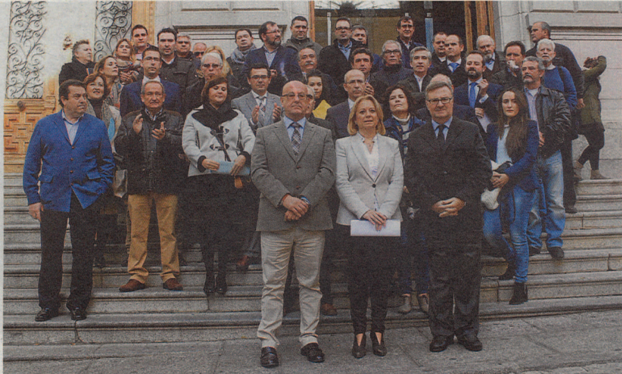
Alcaldes, concejales y diputados provinciales del PP, ayer delante de la sede de la Diputación