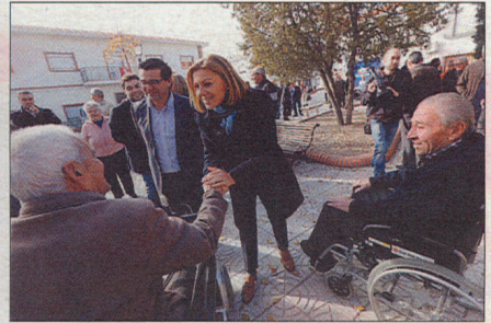
La cabeza de lista de los 'populares' al Congreso visitó una panadería y recorrió las calles de Borox, acompañada por miembros y simpatizantes de su partido.