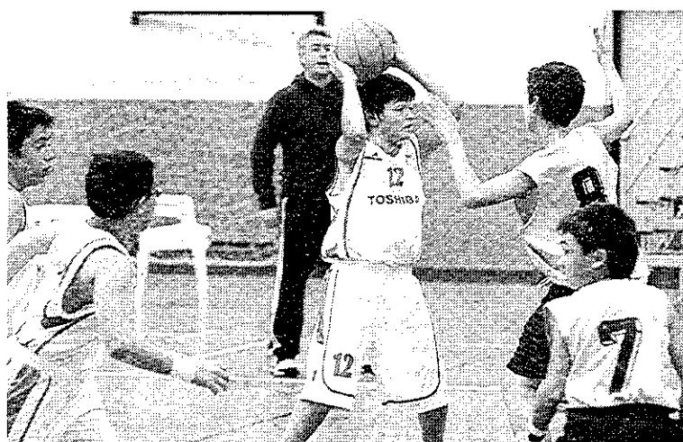
El juego en equipo es una virtud en estas categorías.