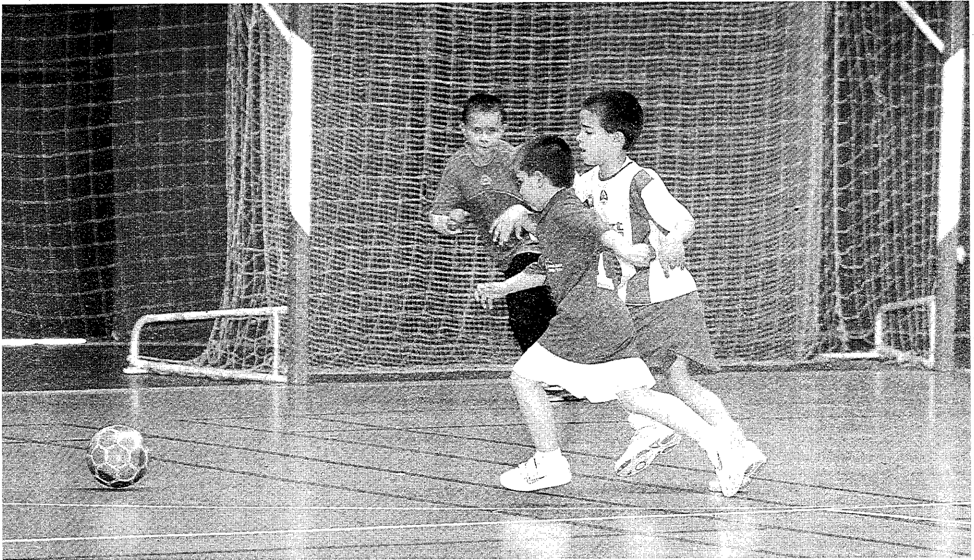
La última jornada registró un gran número de goles.