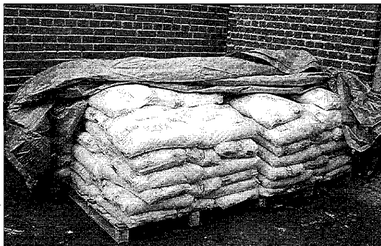
Illescas tenía almacenados más de 6.000 kilos de sal para este invierno.