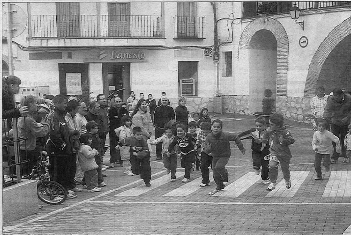
La popular carrera de San Silvestre, con su prueba infantil, también tuvo su edición boroxeña.

En este sentido, Guerrero confirmó que en la noche del 31 de diciembre, decenas de vecinos salieron a las calles para despedir el año 2009 desde la Plaza de la Constitución, donde el Consistorio procedió al reparto de uvas y sidra en colaboración con la empresa Reypama. «Cada año, los vecinos gustan de recibir al nuevo año en compañía», matizó la edil. Por otra parte, como cabía esperar, los actos de mayor participación de la Navidad boroxeña fueron los que tuvieron a los más pequeños como protagonistas. El 4 de enero, Borox recibió la visita del cartero real para la recogida de las cartas dirigidas a los