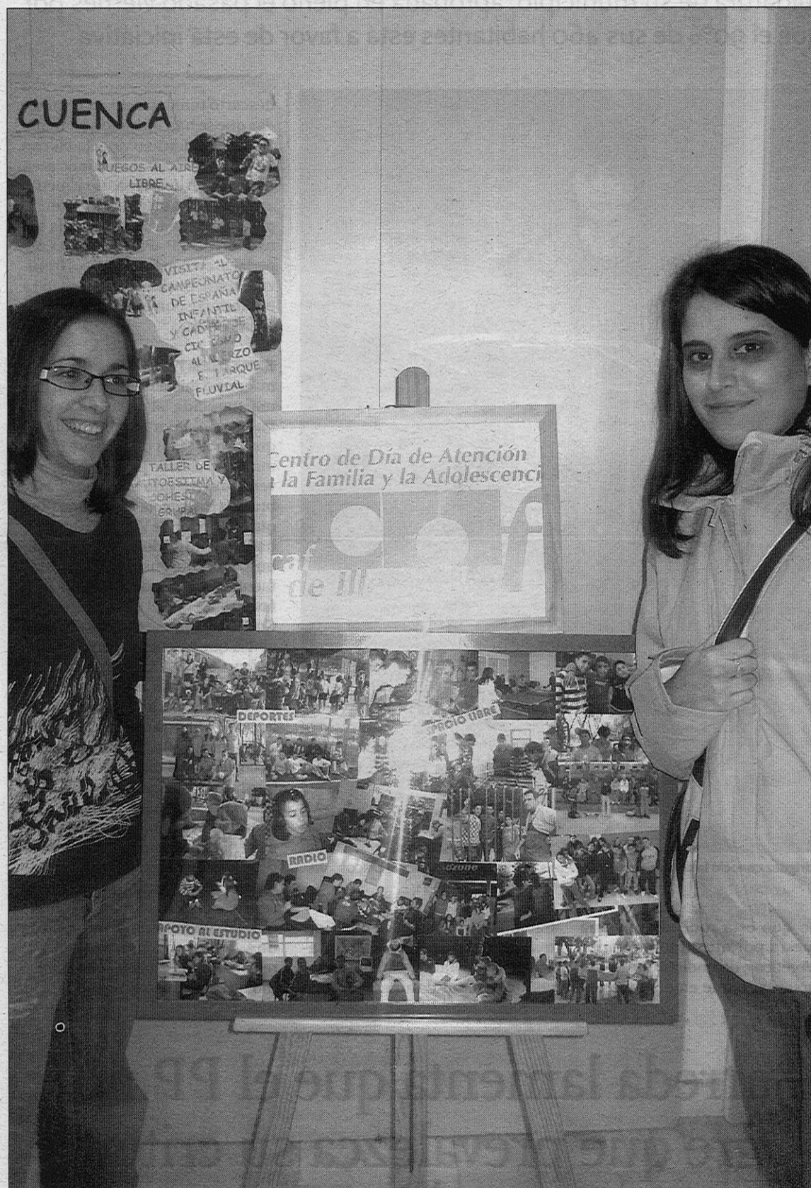
Dos de las profesionales que trabajan en el CAF muestran imágenes de las actividades que han puesto en práctica.