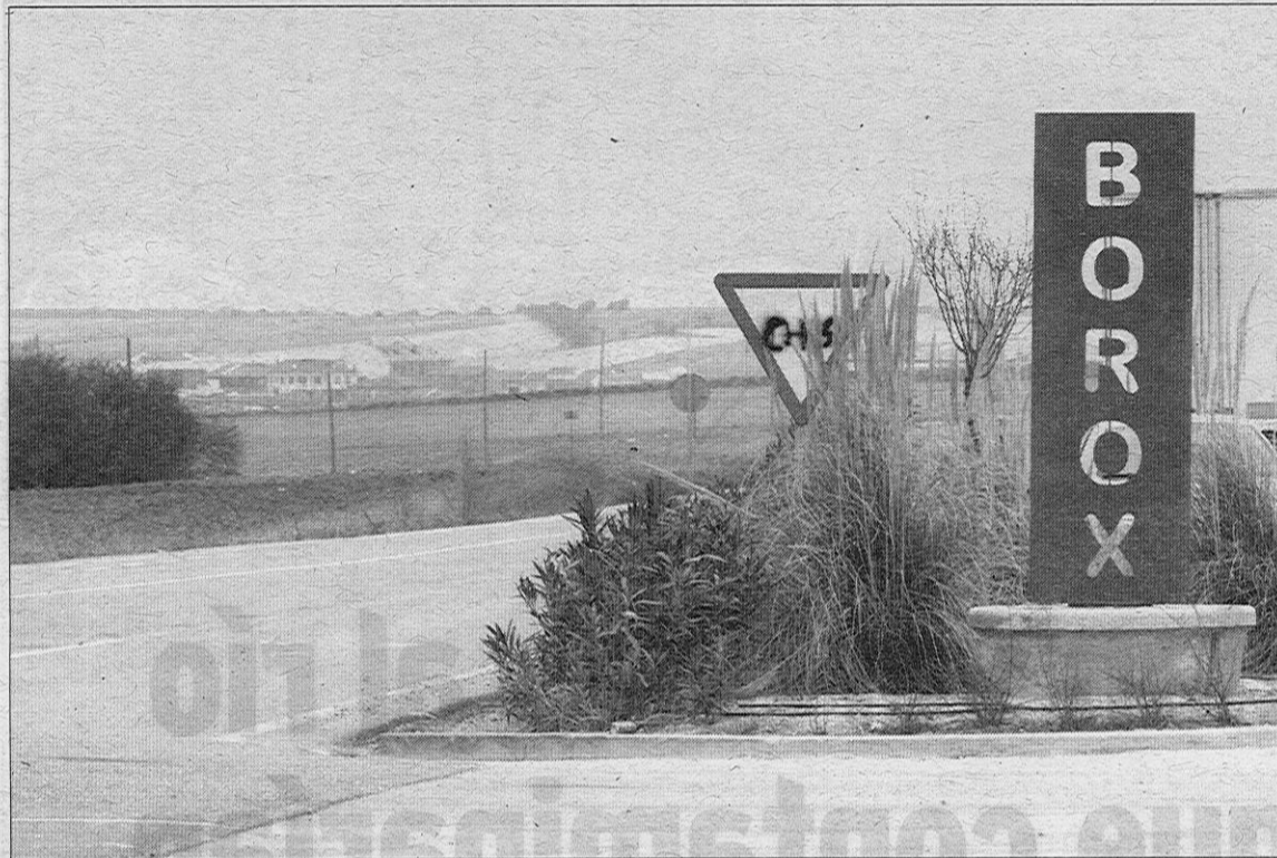
El PSOE justificó el servicio, entre otras razones, para facilitar a los vecinos de Nuevo Borox acudir al pueblo de compras.

En su escrito, que consta en el acta de la sesión de Pleno hecho público, los vecinos de Borox y Nuevo Borox firmantes agradecen, literalmente, «el servicio prestado hasta ahora por el autobús urbano,