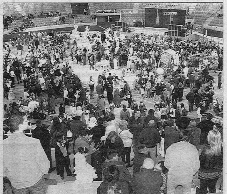
El espacio escénico es el punto de llegada de las comparsas.