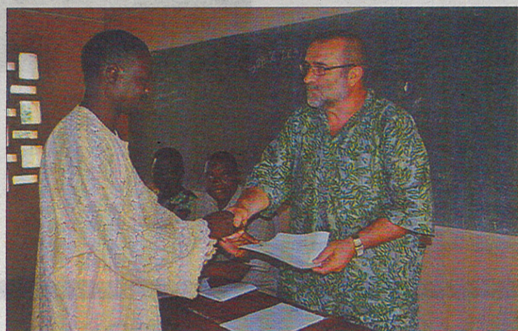
Se realizan acciones formativas para los habitantes de la zona.