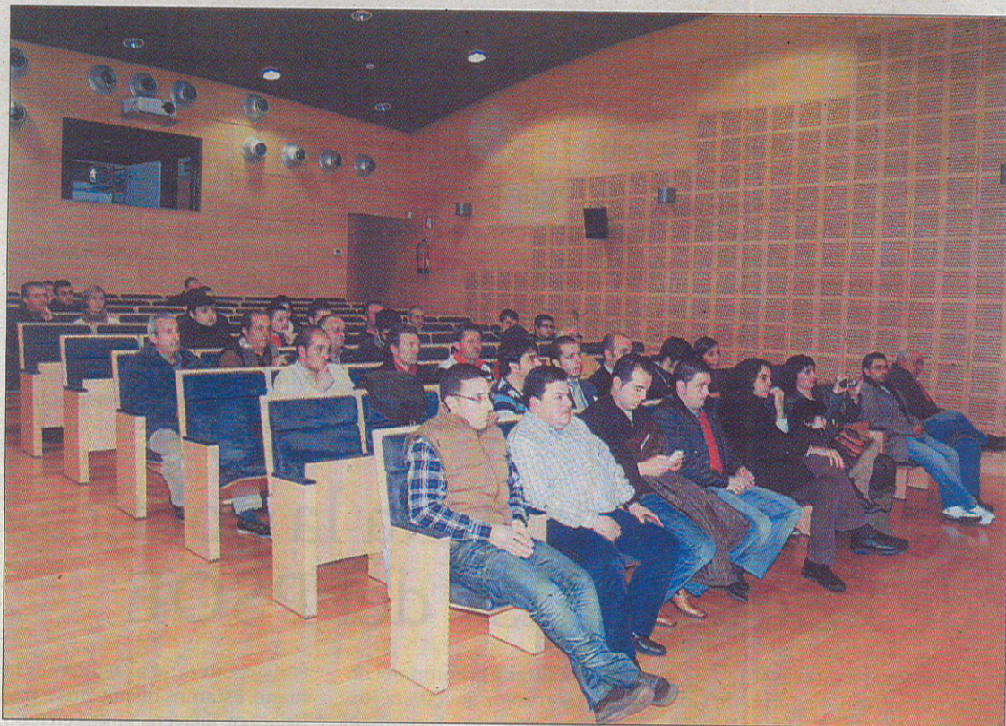
Acudieron los alumnos que van a participar en la iniciativa.

Al igual que la procedencia de los aficionados, también las edades de los estudiantes es muy variada, puesto que existe un alumno de 67 años, siendo el más joven uno de 20.