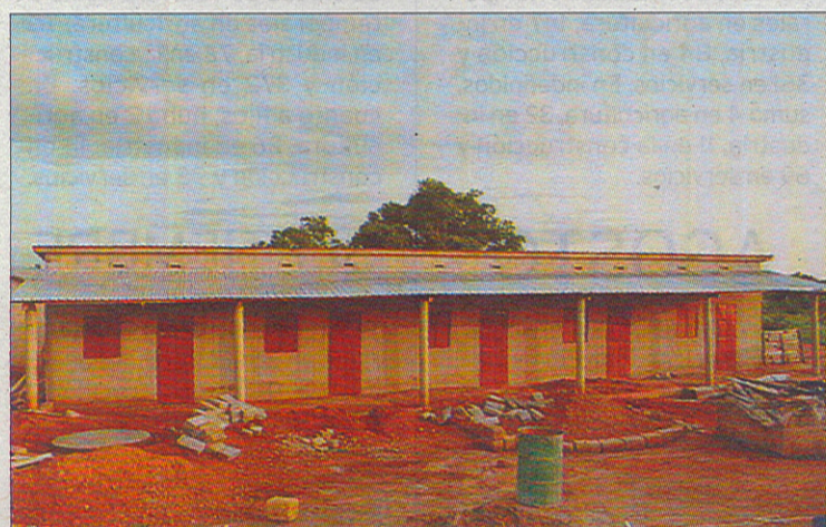
En los últimos años se han construido varias instalaciones.

su formación en el centro implanten en la sociedad iniciativas de futuro que partan de ellos y sean viables, accediendo para ello a un micro-crédito ofrecido desde la Fundación.