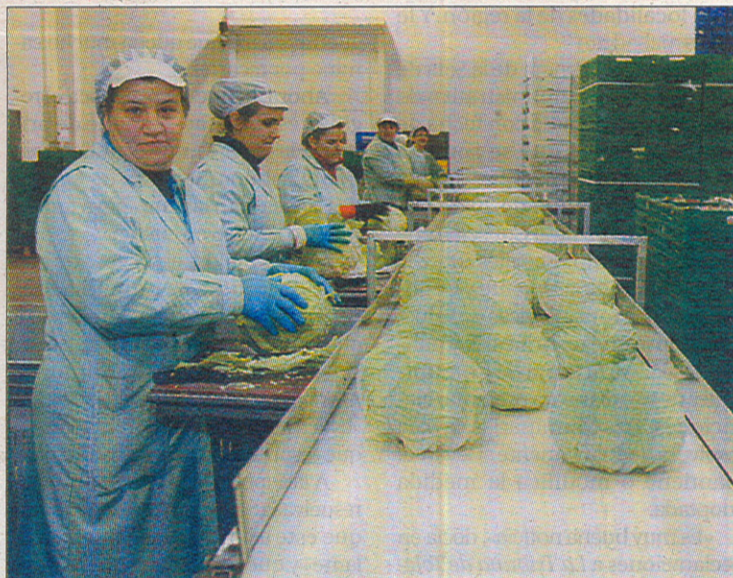
La empresa cuenta con más mujeres que hombres.