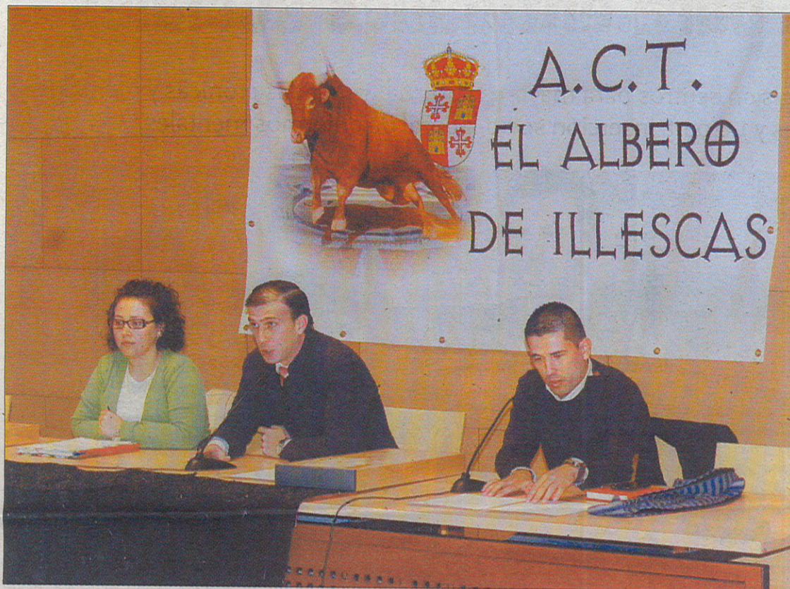
La presentación tuvo lugar el miércoles en la biblioteca municipal.

PERFIL DE LOS ALUMNOS. De estos 30 alumnos inscritos, que se repartirán en clases los viernes por la tarde y los sábados por la mañana, no todos son vecinos de Illescas. Desde Ugena, Yuncos, Numancia de la Sagra, Pantoja, Casarrubuelos y Parla en Madrid llegarán alumnos para aprender el manejo de los 'trastos' de torear.