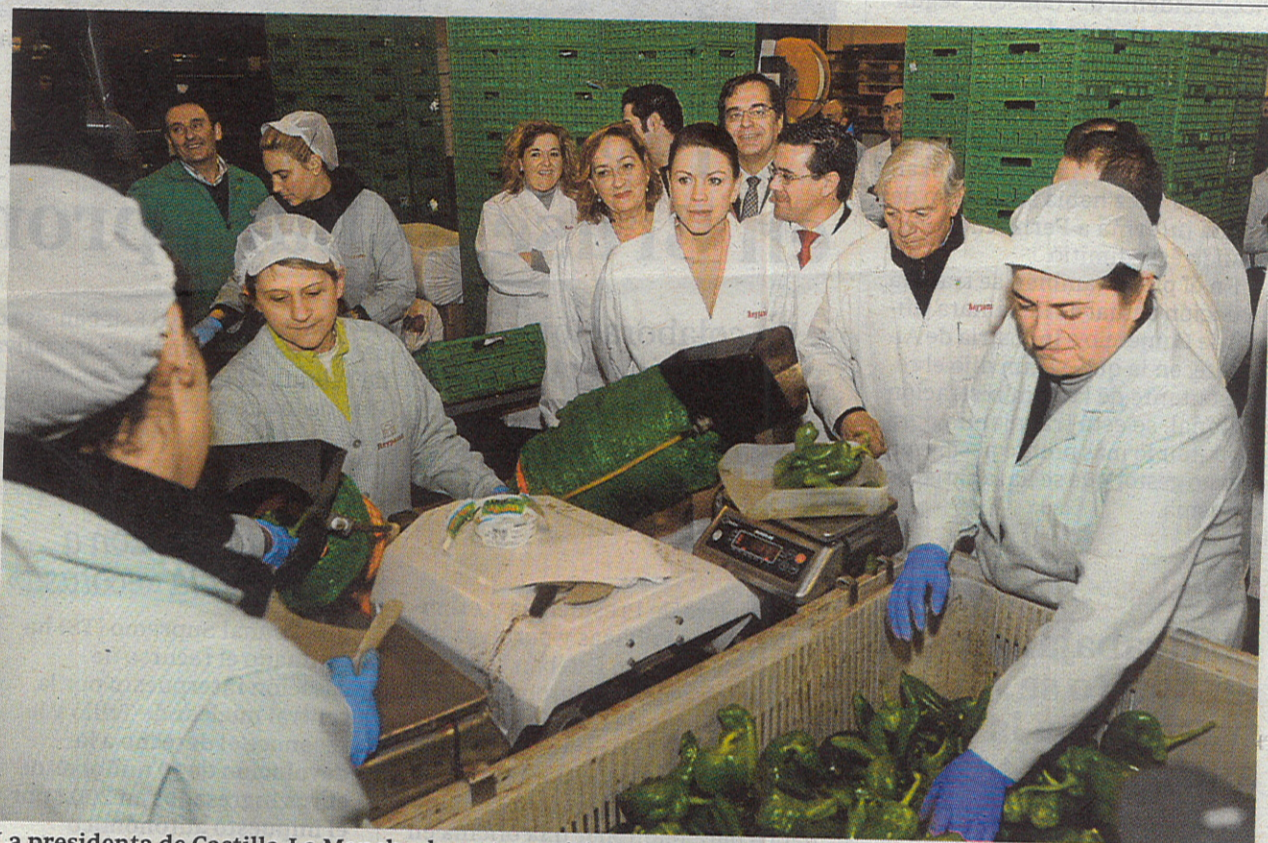
La presidenta de Castilla-La Mancha durante su visita a la empresa de productos hortofrutícolas ANA PÉREZ HERRERA