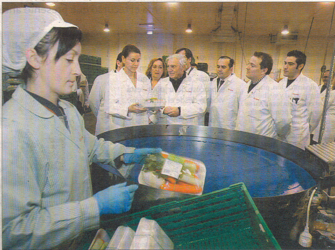
La presidenta pudo conocer de primera mano el proceso de envasado de los productos.

Su constitución data del año 1977, amparada, por un lado, en los cambios emanados del Gobierno por la transformación de los antiguos grupos sindicales de colonización en sociedades agrarias de transformación y cooperativas, para mejorar y racionalizar las explotaciones agrícolas y la comercialización de los productos, así como los canales de comercialización; y, por otro, la iniciativa empresarial con vocación clara de futuro de los miembros fundadores, una vocación que se ha mantenido en el tiempo y que ha hecho de esta empresa lo que hoy es.