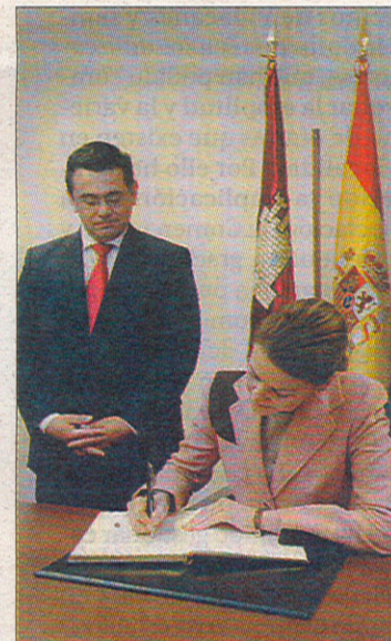
Cospedal firmó en el Libro de Visitas.