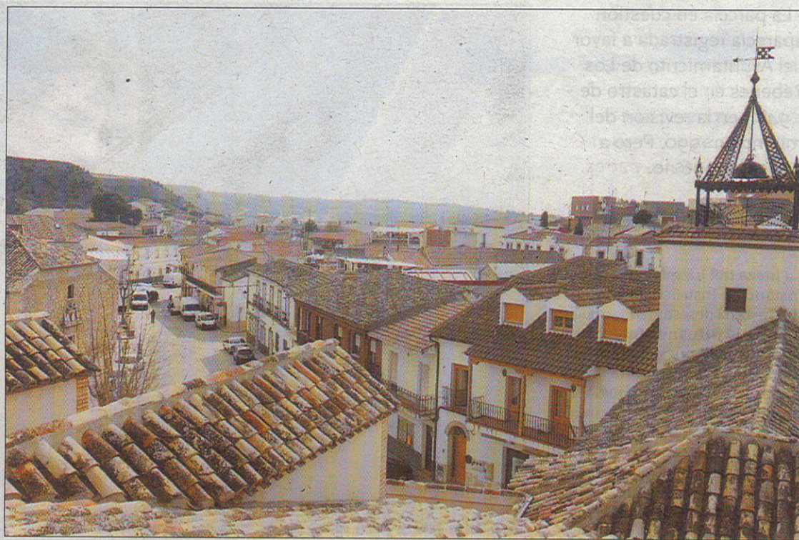
El robo que motivó las detenciones se produjo en Borox durante la madrugada del jueves.

Cuando los agentes comprobaron la identidad de estas personas,