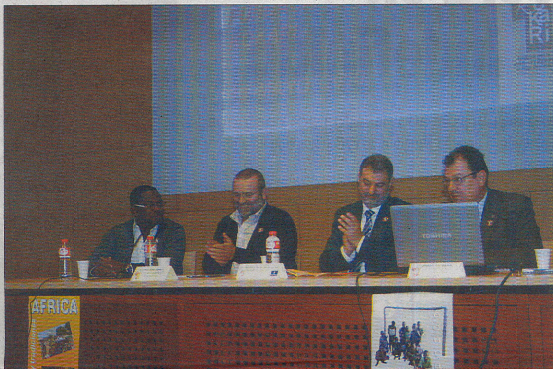
La presentación del proyecto ha tenido lugar en Illescas.

Al tiempo, se contempla la posibilidad de fijar ayudas para que aquellas personas que completen