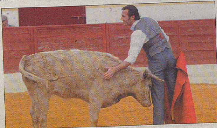
Gesto de felicidad y agradecimiento al animal tras torearlo.