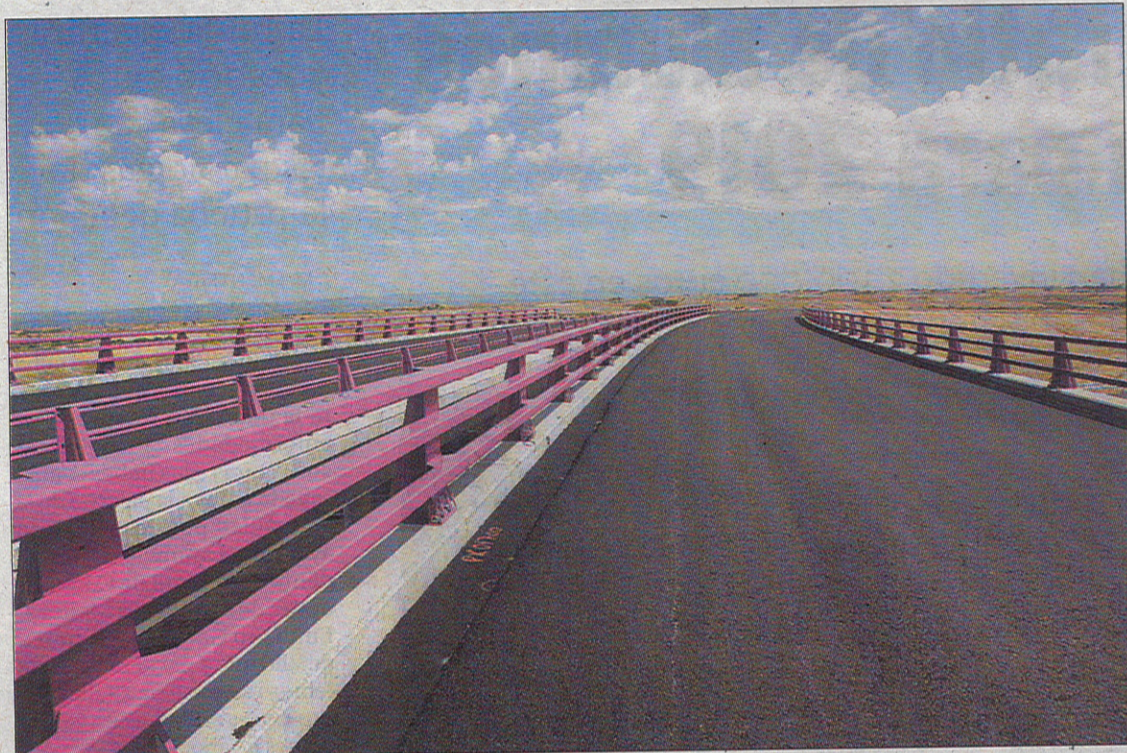
Algunos tramos llevan operativos varios años.