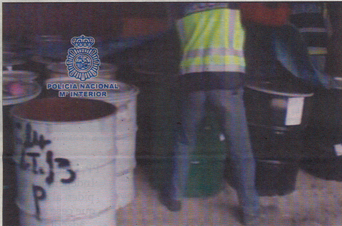
Agentes descubren los bidones con el polvo de platino en el registro de la explotación.

Las sospechas de que la finca era el lugar en que se había escondido el polvo de platino se confirmaron cuando los agentes comprobaron