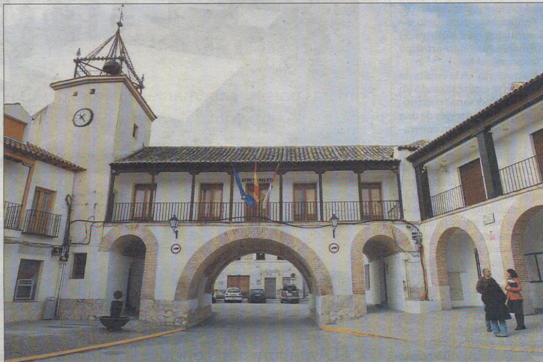
Fachada del Ayuntamiento de Borox.

frío», comentó el regidor de esta población de alrededor de 3.500 habitantes perteneciente a la comarca de La Sagra. El encadenamiento de cuatro siniestros durante el mes de diciembre desató la alarma en la Concejalía de Medio Ambiente, la cual ha publicado un aviso en la página de internet del Consistorio ( www.ayuntamientodeborox.com ) y ha colocado carteles en los recipientes. Con ello, se ha evitado que se vuelvan a producir acontecimientos similares en los últimos días.