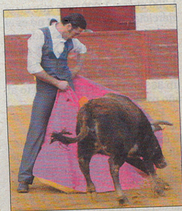
Sensibilidad en cada detalle. /C.ERUSTES