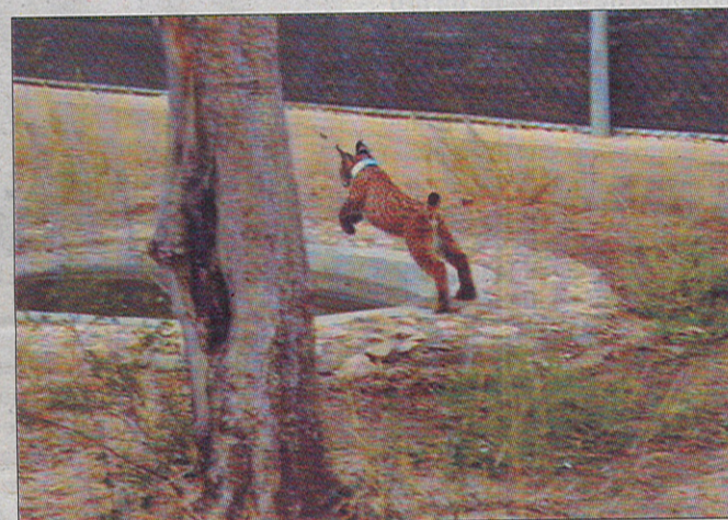
El ejemplar de lince se ha criado en cautividad en Jerez de la Frontera.

Ahora, 'Mosto' se encuentra en el centro de cría de El Acebuche, en Doñana, donde se trasladó desde el Zoobotánico para completar su entrenamiento de cara a su supervivencia en libertad y para socializarse con una hembra de su edad. Así, en breve será capturado para realizarle un chequeo y ponerle un collar con transmisor que permitirá seguir sus evoluciones una vez puesto en libertad.