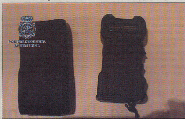
Arma eléctrica 'Taser' hallada en estos registros.