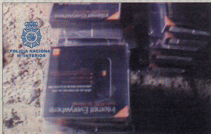
También se encontraron 1.650 tarjetas de telefonía.

que una persona de nacionalidad española, vecina de Borox y dueña de la finca, estaba intentando vender el polvo de catalizador en pequeñas cantidades para no levantar ningún tipo de sospecha.