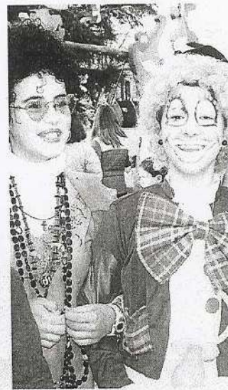
Colorido y combinación en los disfraces