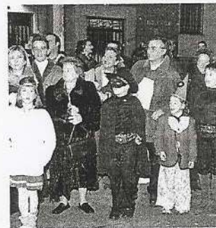
El alcalde no se perdió el desfile