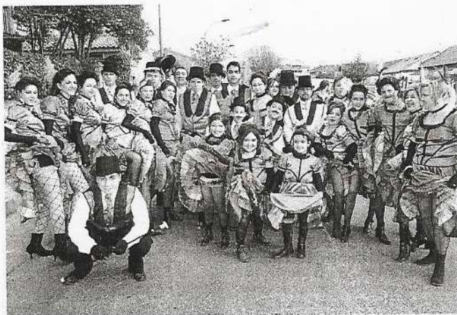
Comparsa «El molino rojo», de la localidad de Carpio de Tajo

ABC. La Capilla Arzobispal de la Inmaculada Concepción acogerá en Toledo la Adoración Perpetua al Santísimo Sacramento. El objetivo es conformar una cadena de adoración continua, solicitando a las personas que pudieran estar interesadas en adorar al Santísimo una hora a la semana que se pongan en contacto con los responsables de la iniciativa en el 649 65 68 00.