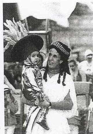
Los olímpicos «Toledo 2012»

Después del recorrido en el Ferial tuvo lugar la actuación de Los Lunnis, aunque para algunos niños fue imposible ver la actuación debido al numeroso público, eso sin contar el ambiente cargado de humo de cigarrillos que tuvieron que soportar los más pequeños.