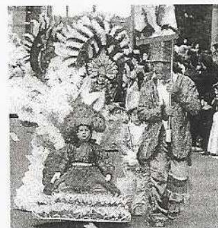
«Colorines», de Toledo