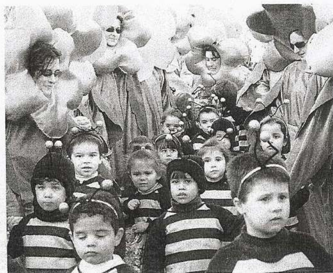
Uno de los grupos de escolares participantes en el carnaval de Talavera