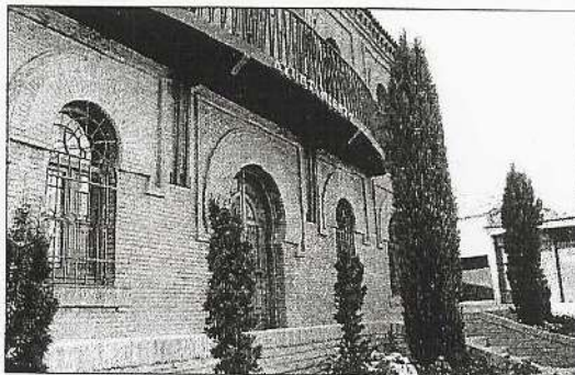
El Pleno también aprobó que la gestión del agua sea por concesión administrativa, R.C.

También por unanimidad se aprobó la nueva imagen del escudo de Illescas; el expediente de contratación y pliegos de condiciones técnicas y administrativas para el proyecto de obra de saneamiento y abastecimiento de la zona PEIS Nº 1 y 2. Además se dio visto bueno a la modificación del estudio detalle de la zona UE 19, zona del Pol. Ind. de Matajudios,