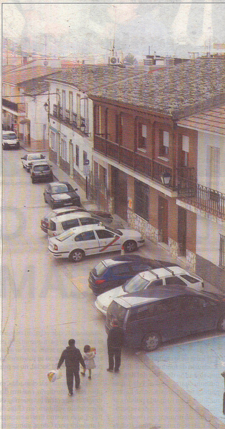
La nave investigada está ubicada en Borox. / DAVID PÉREZ

Las investigaciones culminaron recientemente con la imputación al empresario investigado por un delito contra los derechos de los trabajadores, después de que fuese practicada una inspección en su nave, en la que pudieron confirmarse las sospechas que existían en relación con ese lugar.