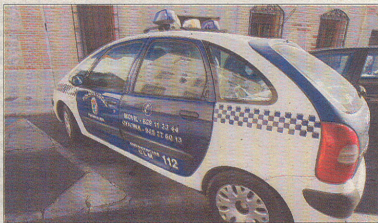
El hombre se mostró muy violento en el momento de su detención.

La niña fue devuelta a su madre en perfecto estado gracias a la colaboración vecinal, que ha sido determinante para ayudar a los agentes de la Policía Local.