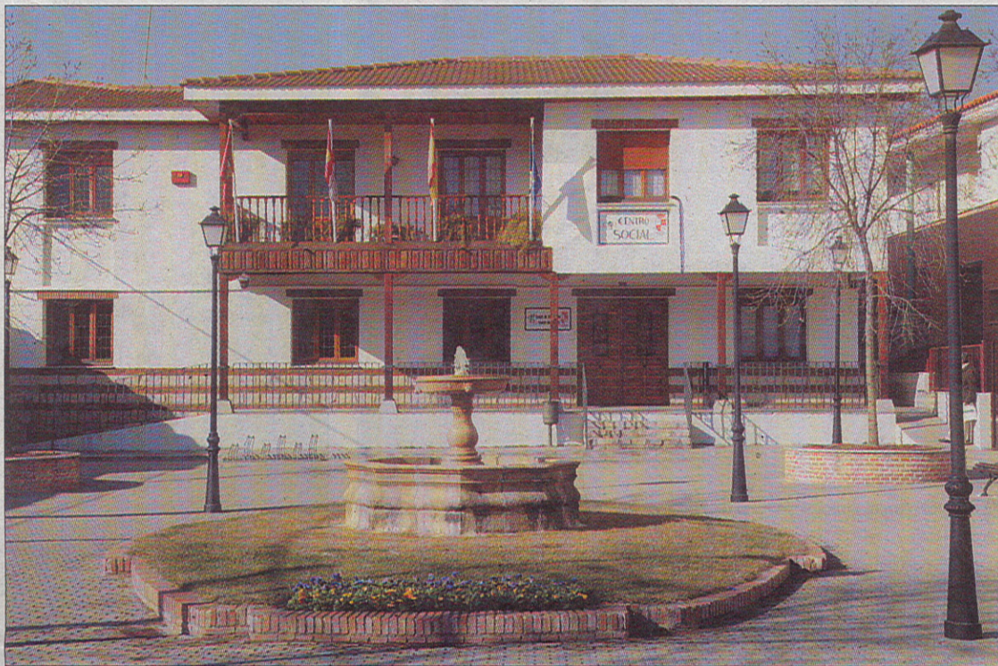
El PLIS se desarrolla en Illescas desde el Centro Social.

Con la renovación del Plan Local de Integración Social, continuará también el trabajo con beneficiarios de los programas que llevan a cabo entidades ajenas a la Administración, aunque financiadas por ella, que participan en el desarrollo de este Plan de inte-