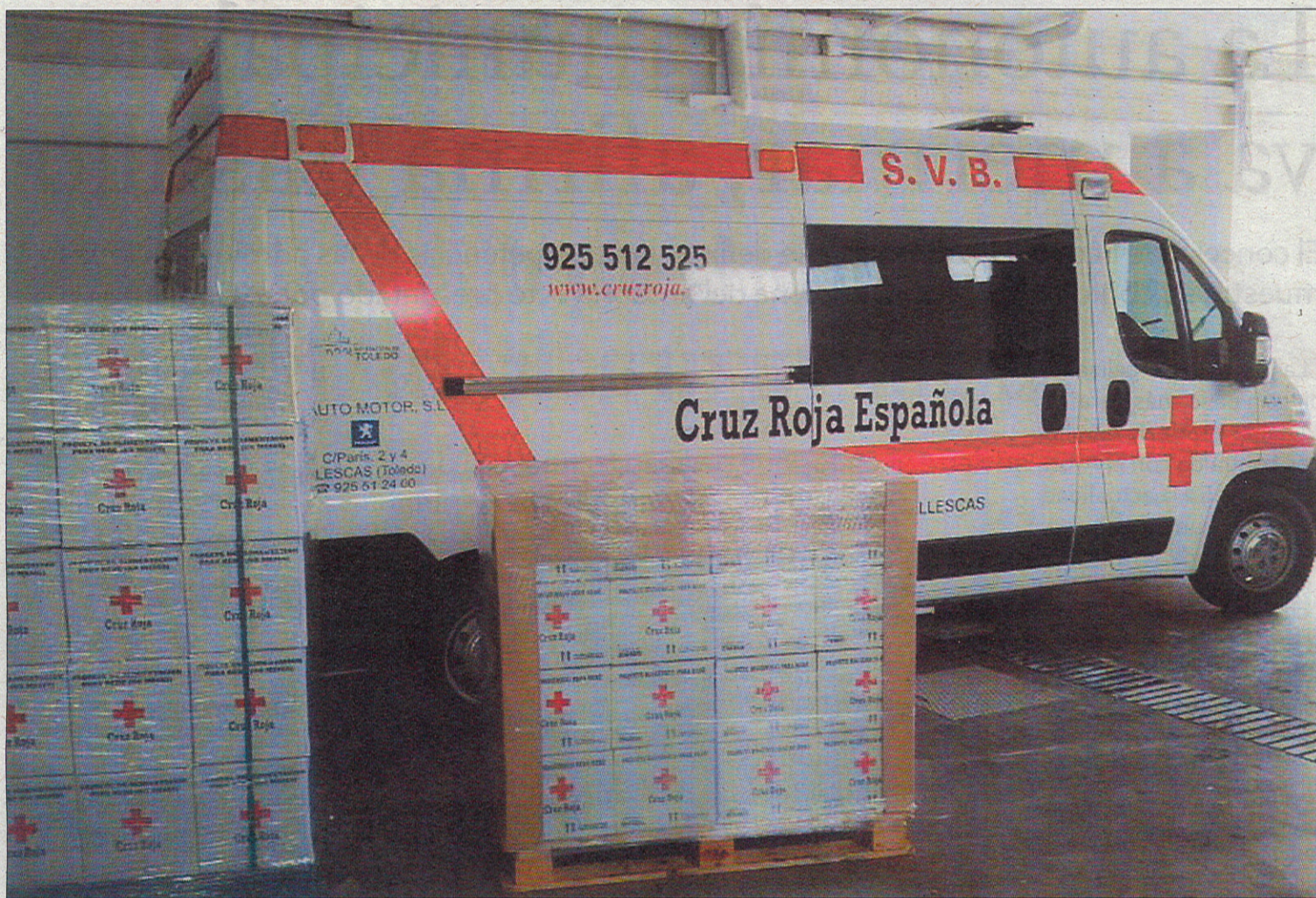
Se repartirán kits de higiene para el hogar, así como otros de aseo y comida para bebés. / R.C.