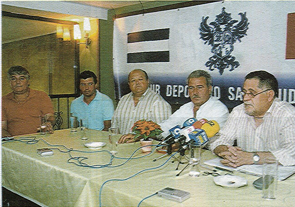
La actual Junta Directiva del San Prudencio, histórico club talaverano que vuelve a la palestra