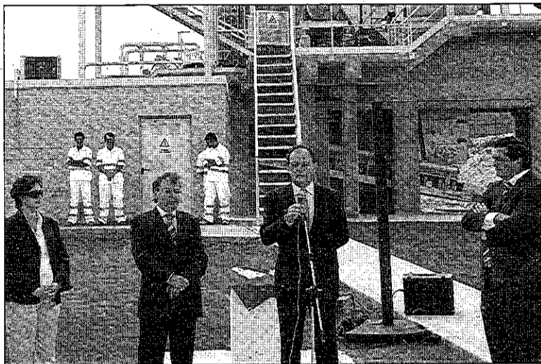
Instante de la inauguración de la nueva planta, el pasado 11 de junio