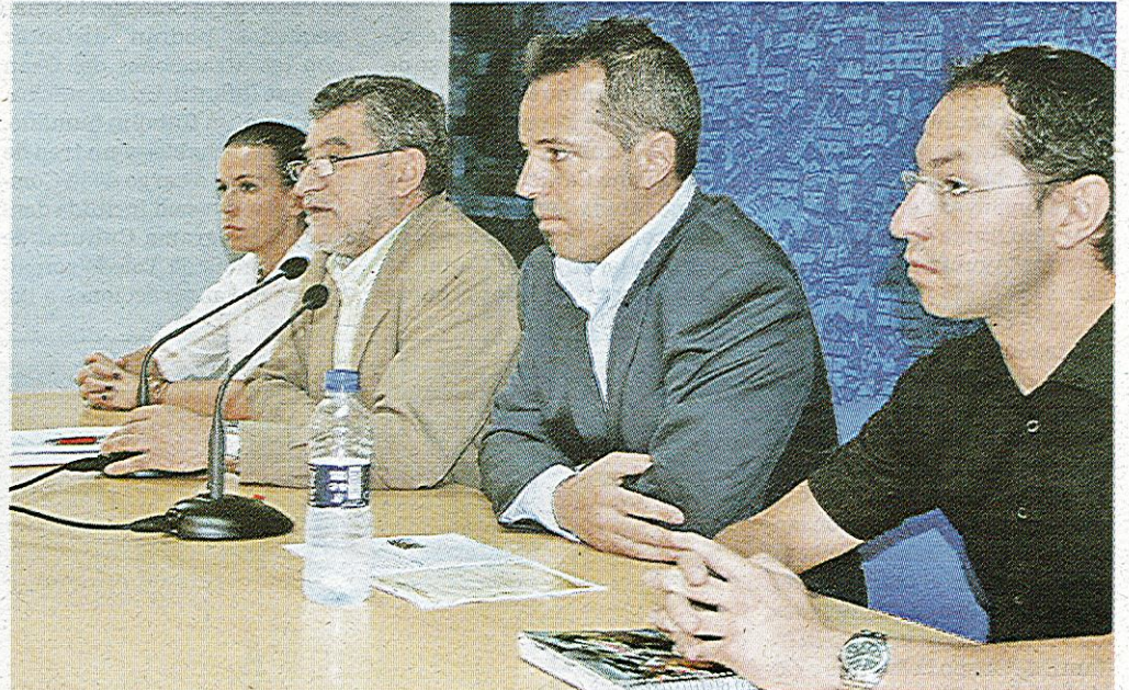
El vicealcalde de Toledo, con el alcalde de Yuncler y el presidente del MotoClub

Los inscritos disfrutarán de varias actividades, desde una exhibición de freestyle con minimotos hasta una cena en Yuncos para los primeros 500 inscritos y la tradicional ru-