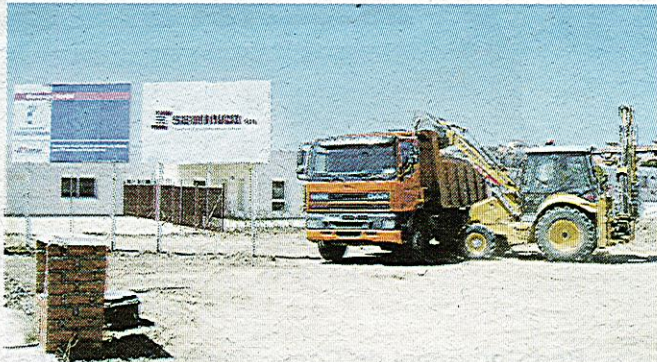
Los terrenos del aparcamiento son de propiedad municipal

El centro contará con un aparcamiento con capacidad para 113 vehículos. Además, según informa el Gobierno local, se acondicionarán terrenos colindantes de propiedad municipal para esta instalación, evitando así riesgos innecesarios en las salidas de los colegios. Por otro lado, la mesa de adjudica-