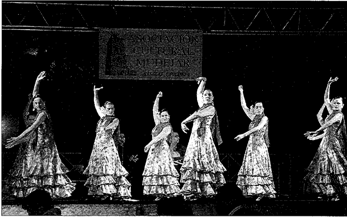
Saldrán a escena los grupos de baile de la Asociación 'Mudéjar', la banda de música y la coral.

Fuentes municipales de la Concejalía de Cultura del Consistorio illescano han manifestado su satisfacción «por el empeño que han mostrado las asociacio-