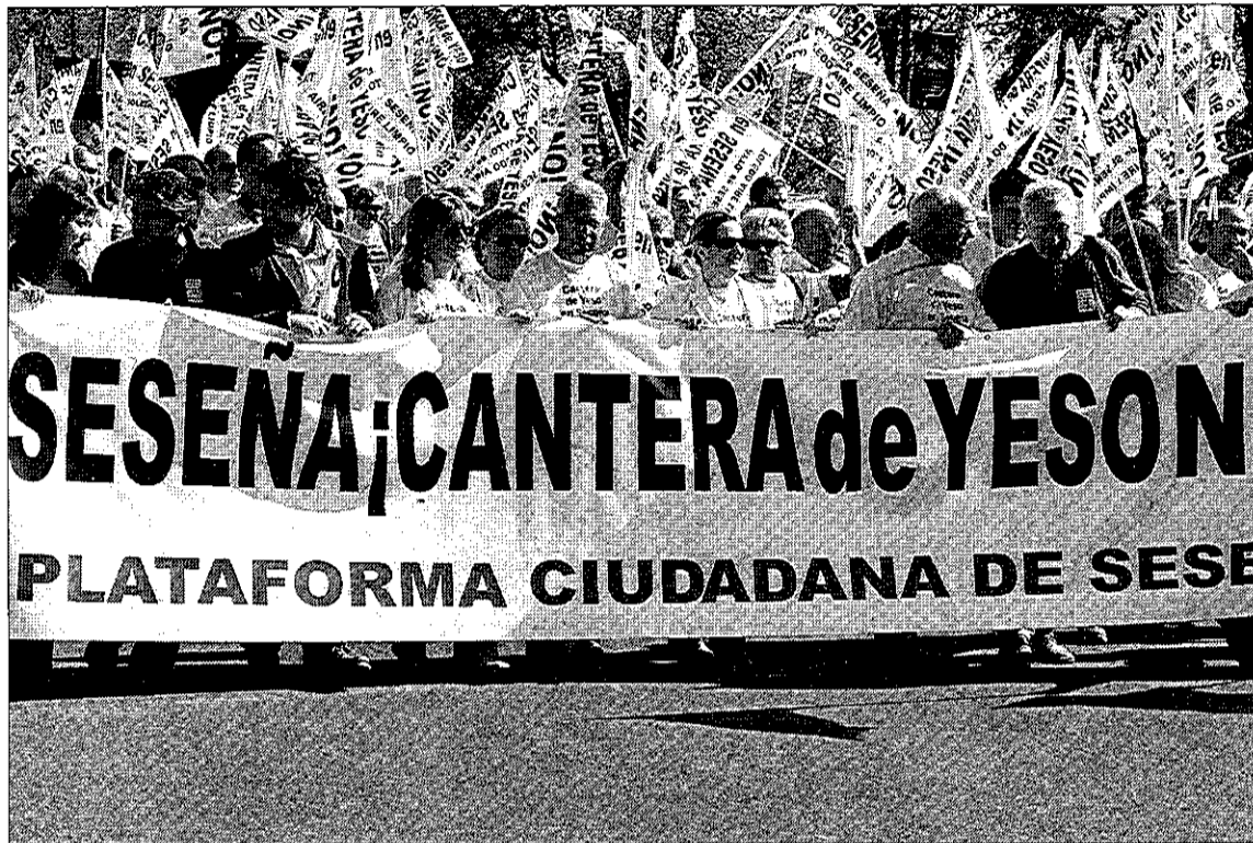
En abril de 2006, decenas de vecinos se manifestaron en Toledo en contra del proyecto.

ha estado coordinando la plataforma vecinal contraria a la cantera, comentó a La Tribuna que «en principio la valoración es positiva». Esta vecina de Seseña señaló que la movilización vecinal se hizo cuando se consideró que se tenía que hacer, y, a partir de ahí, se confió en los grupos políticos para que fueran ellos quienes, con su trabajo, se encargaran de evitar la puesta en marcha de la cantera de yeso. «Desde el momento de la cantera de yeso. Desde Pleno la modificación de las Normas Subsidiarias entendimos que nuestro trabajo había terminado», manifestó. Ahora, «sólo esperar a la confirmación ofi-