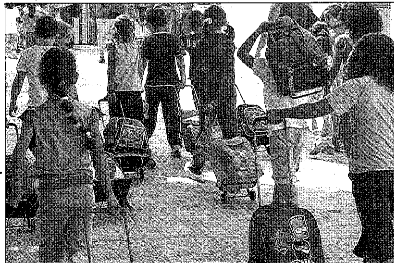
La inversión que llevará a cabo la Junta potenciará la calidad educativa de la localidad

Dicho desarrollo, considerado como necesario para la localidad dado su crecimiento poblacional, supondrá incorporar un total de nueve unidades (tres de infantil y seis de primaria) y será ejecutada para satisfacer las necesidades de los alumnos. Con esta iniciativa, se reforzarán las prestaciones de una población que durante años únicamente ha contado con las instalaciones del antiguo centro San-