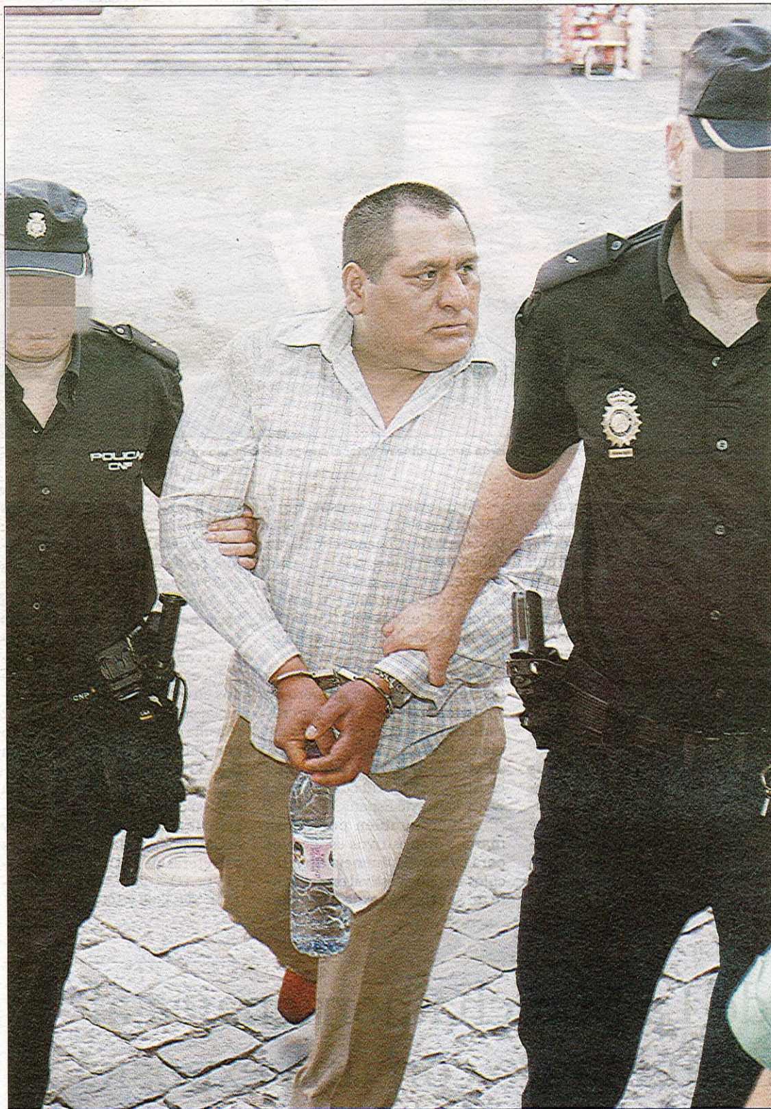
Percy R.R.L. afirmó en su defensa que «quería como un hijo» a la víctima. / V. B.

El magistrado refleja en la sentencia que el Jurado determinó la culpabilidad en base a las pruebas vistas en el juicio. Estas pruebas se centran en que ha quedado demostrado que víctima y acusado estaban solos en el momento de los hechos, en que el informe forense deja claro que la muerte no fue accidental, y las contradicciones en que el acusado incurrió en sus declaraciones durante todo el proceso y su esfuerzo en ocultar pruebas y no colaborar con los investigadores del