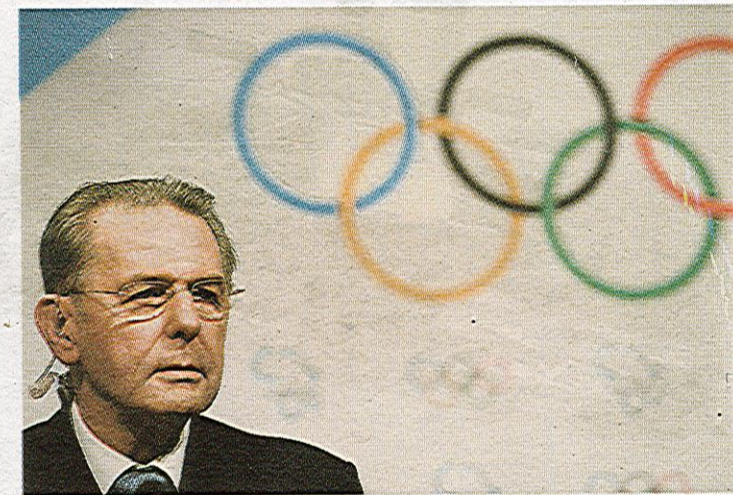
Jacques Rogge, presidente del COI, durante la elección de Pyeongchang.

Por otra parte, el portavoz socialista en el Ayuntamiento y ex secretario de Estado para el Deporte, Jaime Lissavetzky, señala las disensiones sobre la candidatura entre Ayuntamiento y Comunidad. El secretario general del PP de Madrid, Francisco Granados, cree que no se debería optar pues la situación económica "no aconseja un gasto tan importante".