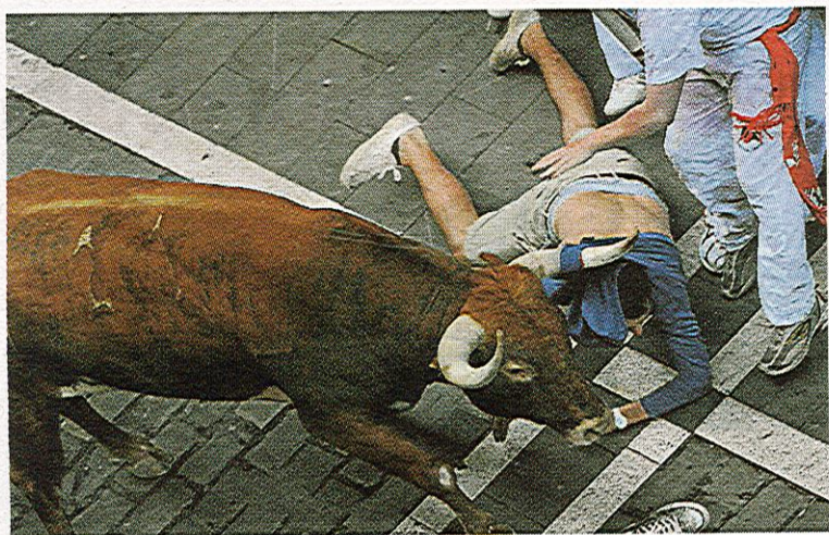
El encierro de ayer estuvo lleno de incidentes y acabó con un herido grave.

Hombres-G. N. Nicolai-Martino (ITA), 2; Mesa-Lario, 1 (21-18, 13-21, 15-6). Grupo O: Herrera-Gavira, 1; Xu-Wu (CHN), 2 (21-14, 19-21, 6-15). 1/16 final: Herrera-Gavira, 0; Samoilovs-Sorokins (LAT), 2 (lesión Herrera). Mujeres. 1/16 final: Liliana-Baquerizo, 2; Nylstrom-Nystrom (FIN), 1 (29-27, 19-21, 15-11). 1/8 final: Liliana-Baquerizo, 0; Larissa-Juliana (BRA), 2 (25-27, 16-21).