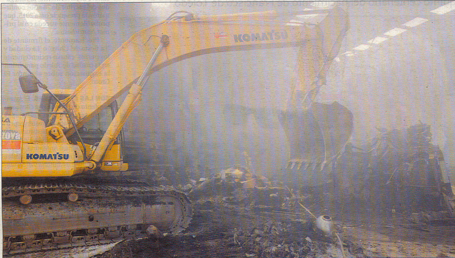
Una retroexcavadora retira los restos calcinados, ayer en la nave industrial de Borox.