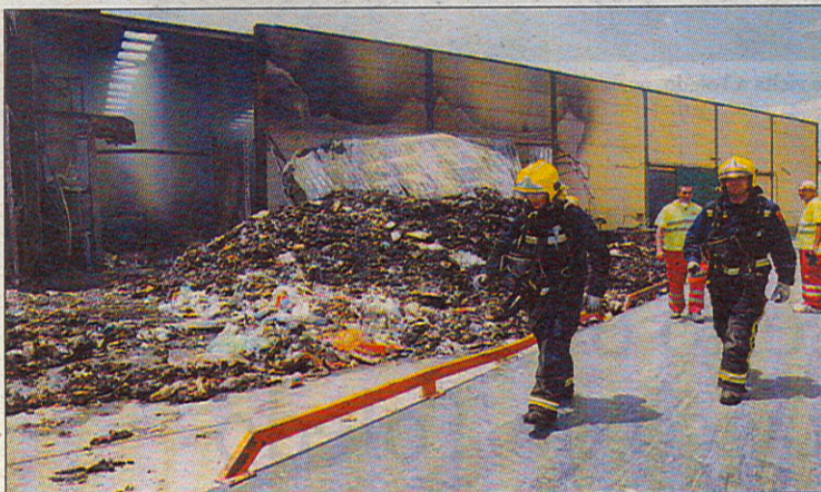
Los bomberos pasan junto a la superficie afectada.