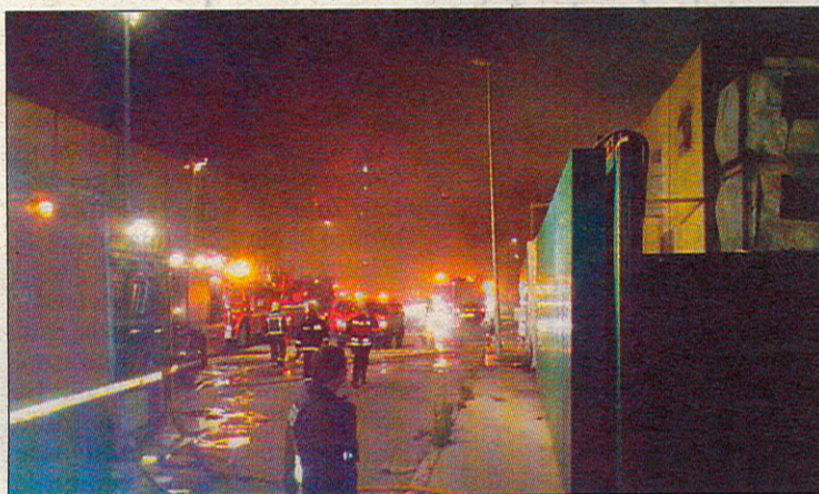
En plena tarea de extinción de las llamas.