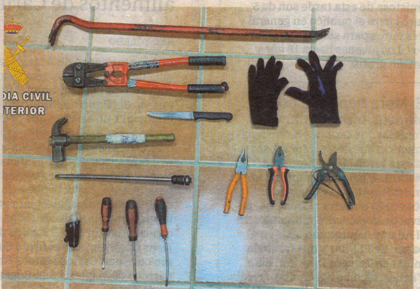
Material incautado para cometer los distintos robos