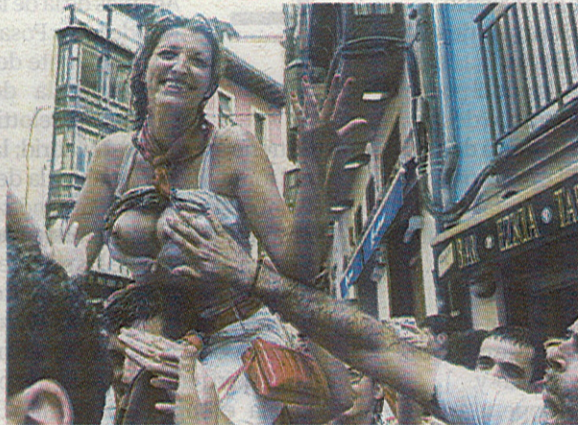
Una moza destapa sus pechos y sufre tocamientos de algunos hombres durante el chupinazo de ayer

Los servicios médicos sólo tuvieron que atender a algunas personas que precisaron ayuda por traumatismos y heridas por aglomeraciones y accidentes.