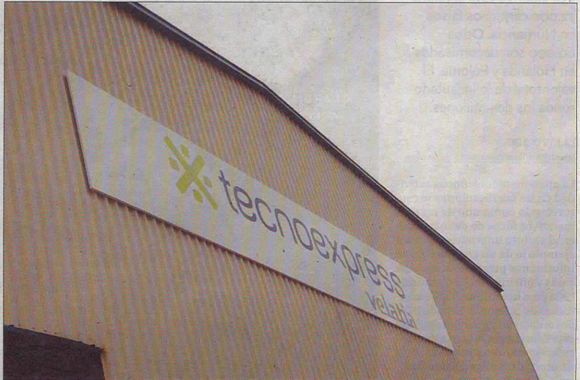
Tecnoexpress está situada en un área industrial de Seseña.

Intimus, integrada en el conglomerado de Capital Riesgo PHI, ofrece sistemas y procedimientos de se-