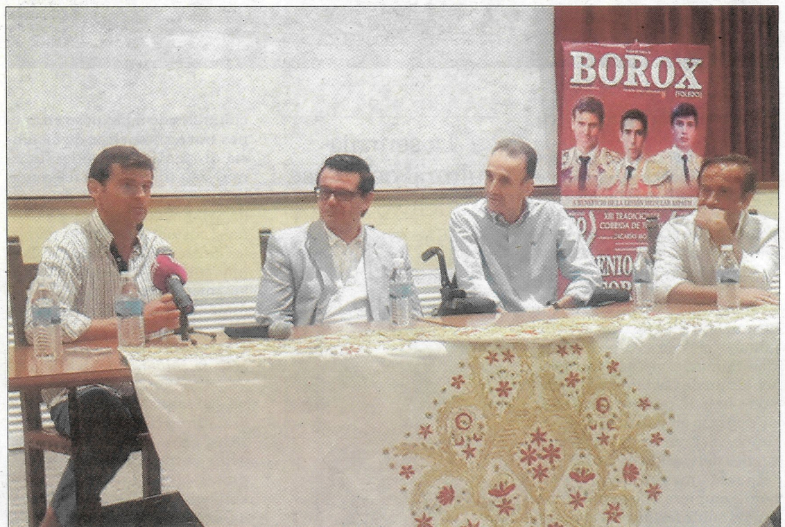
Borox acoge por segundo año este evento solidario.

Los organizadores esperan que sea todo un éxito el festejo y que el público acuda para llenar el coso taurino del sagreño municipio de Borox por una buena causa.