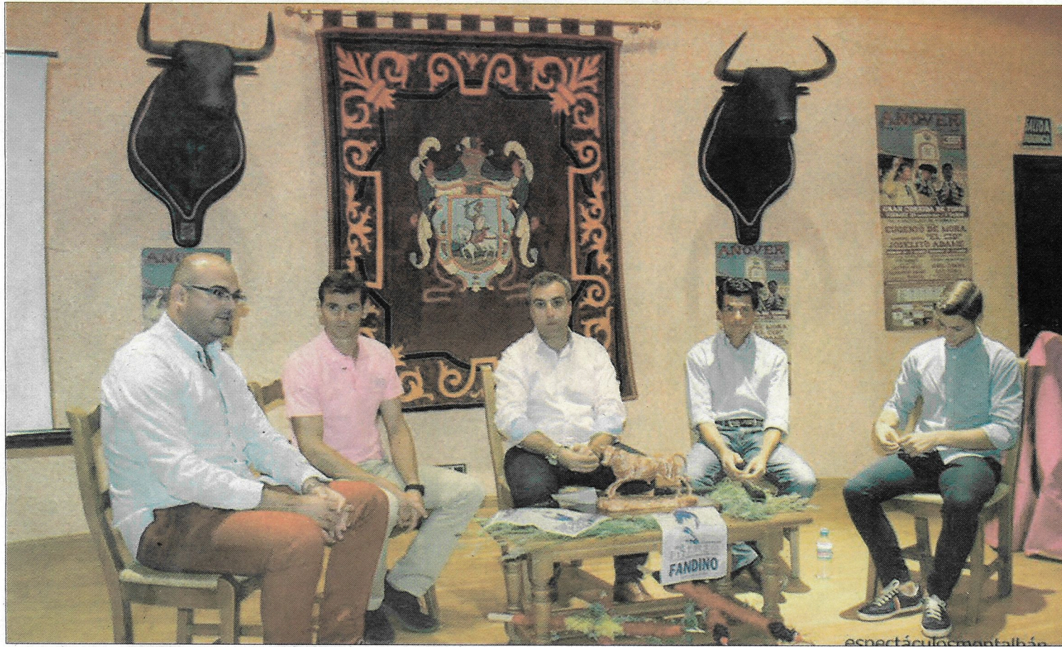
La Feria taurina de Añover se ha presentado este fin de semana.