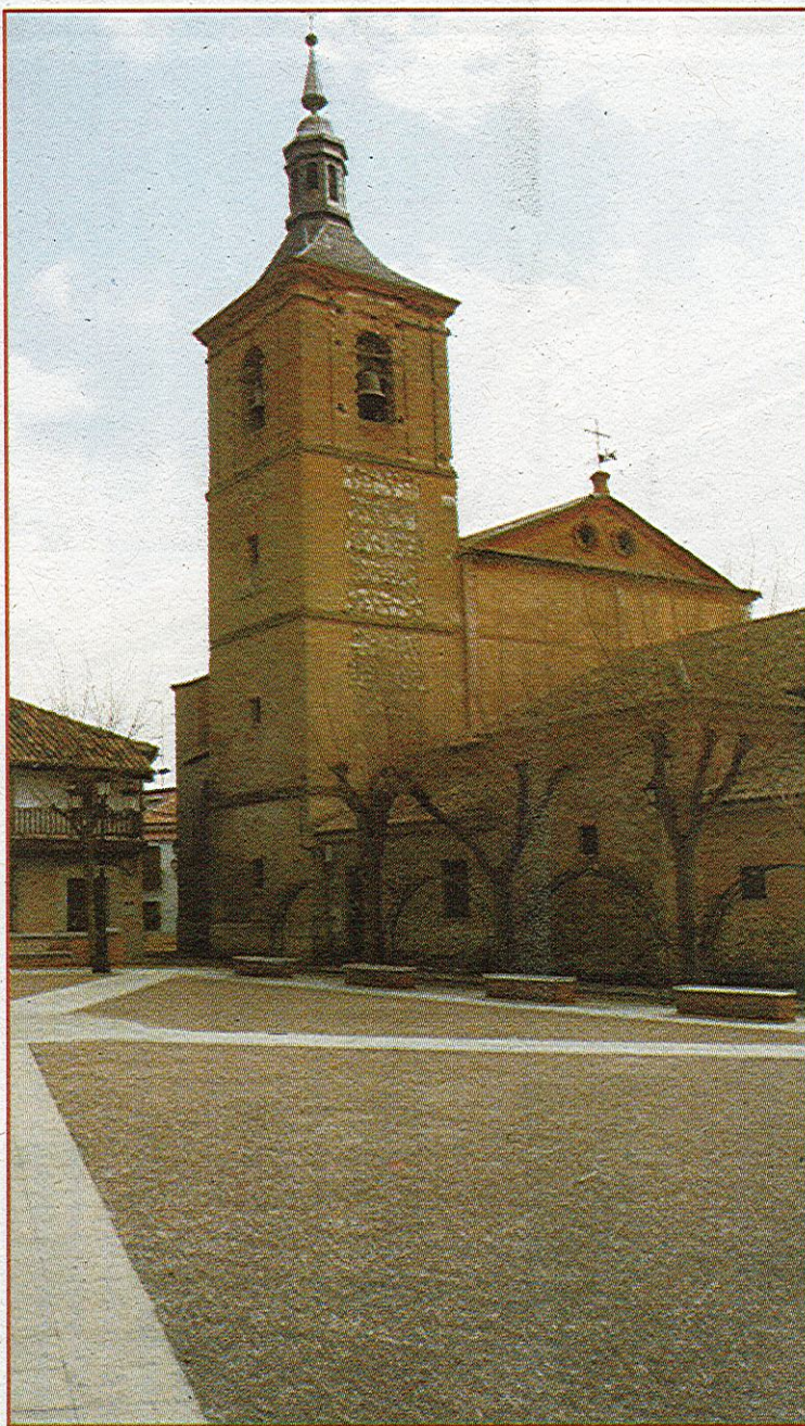
Dicen que al caer la noche pueden evocarse tiempos de arrieros, posadas, mercaderes...D.P.

alberga un retablo al óleo de la Asunción de la Virgen, pintado en el año 1804 por Jacinto Gómez y Pastor, discípulo de Bayeu y pintor de cámara de Carlos IV. También resulta fascinante contemplar la Ermita de Nuestra Señora de la Salud, de estilo barroco, que comenzó a construirse en 1725 y se terminó en 1735.