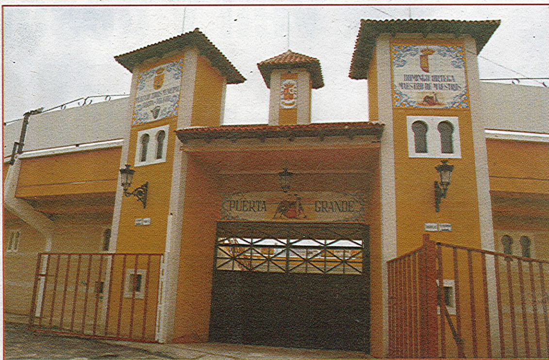
La tradición taurina de Borox llega más allá de la plaza de toros, también tienen un busto dedicado a Domingo Ortega.