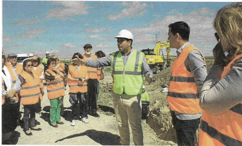
El alcalde y vecinos atienden las explicaciones del director de la obra JCCM

El director técnico explicó que los plazos de la infraestructura se están cumpliendo y que en un plazo de 15 días podrá terminarse el último tramo de tubería de conducción. Asimismo, indicó que se está desarrollando