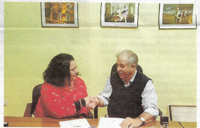
Momento de la firma entre las dos instituciones.

El año pasado, gracias a este convenio se pudieron atender las necesidades de una veintena de familias y a algo más de medio centenar de escolares. En total, gracias a estas iniciativas, las familias beneficiarias han superado la treintena.