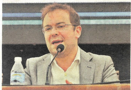
CLUBES DE LECTURA TOLEDO Borox 7 de junio de 2018

nicipios, que forman una familia que se complementa gracias a los libros.