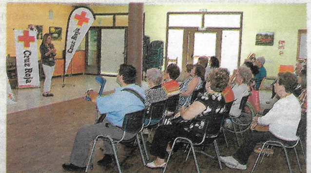
Público asistente a la charla de Cruz Roja.