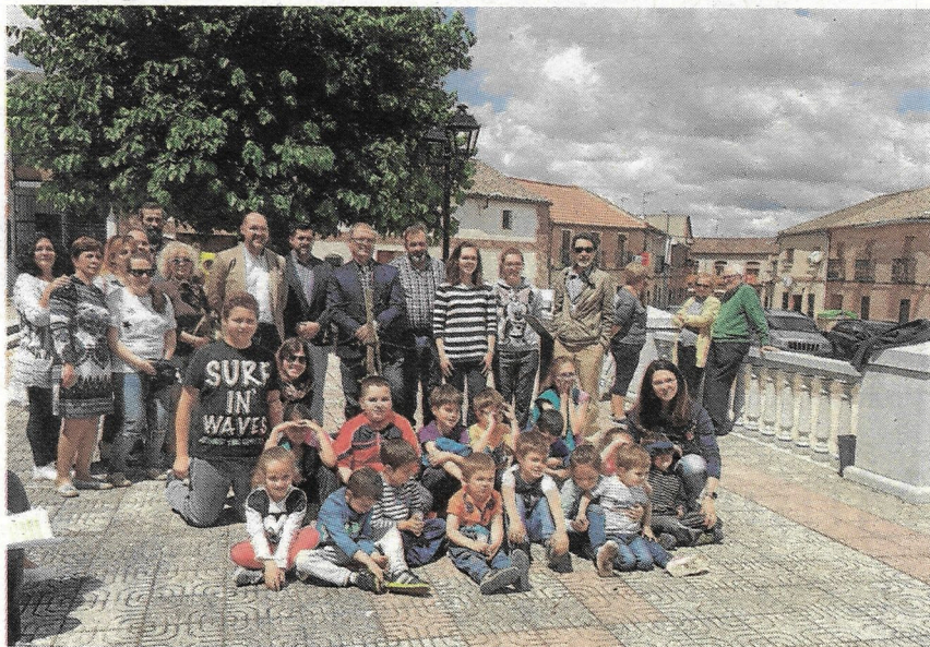
Los alumnos del colegio público realizaron la plantación

Y destacó que el cuidado de los entornos naturales «es un factor clave