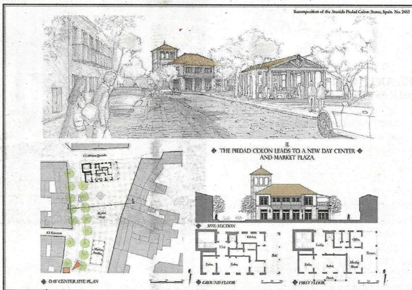
Aspecto de la Avenida de la Piedad Colón tras la recomposición