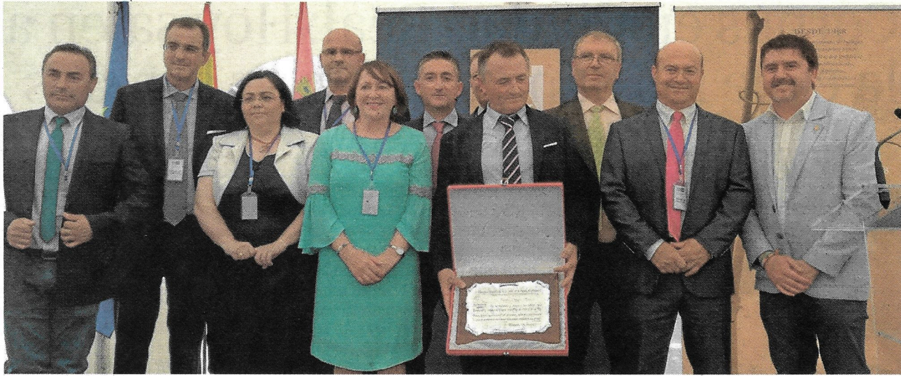
La directiva de la cooperativa Santo Cristo de la Salud