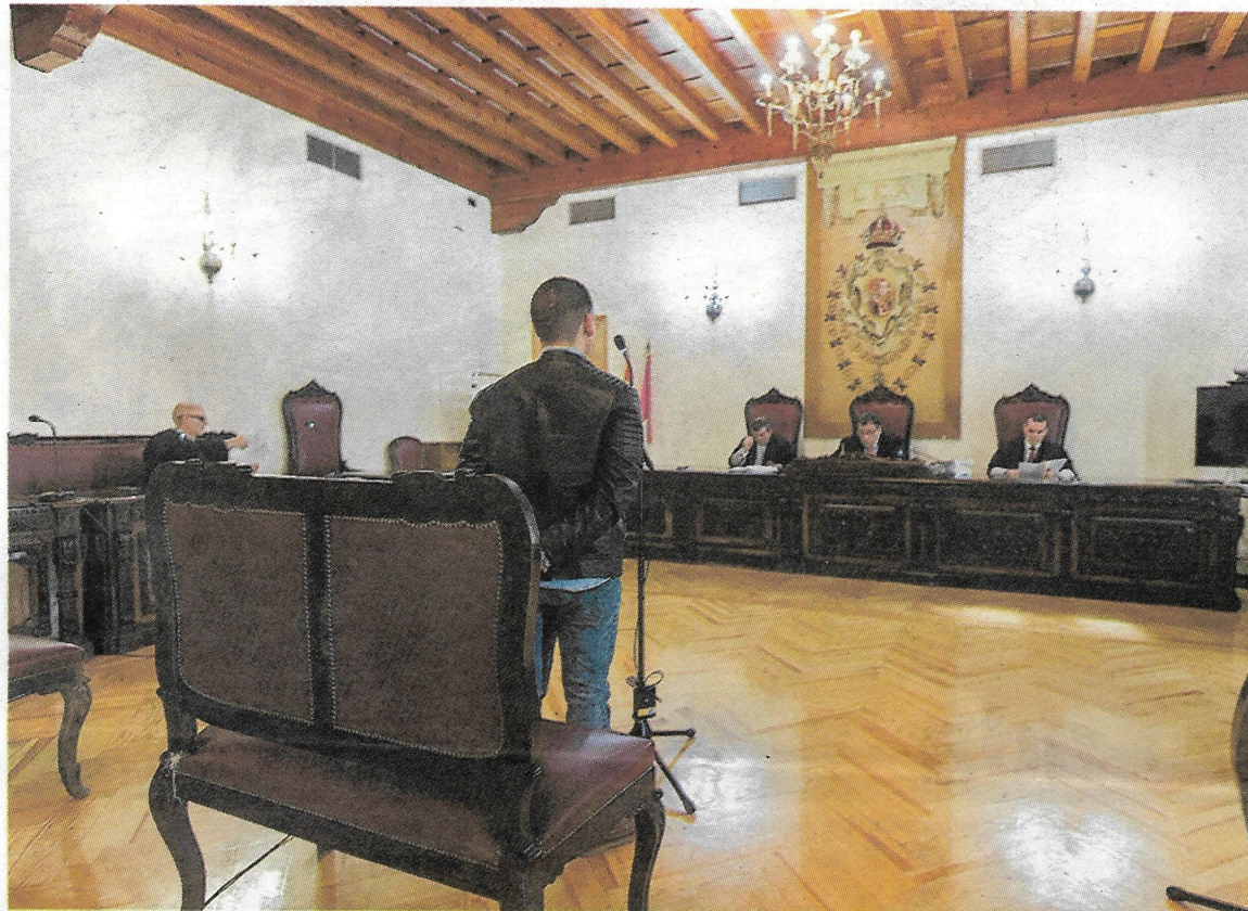
El acusado ahora absuelto, durante la declaración en la Audiencia Provincial.

La sentencia advierte de que la continua persecución de la madre para conseguir la incriminación del padre o incluso la adopción de medidas que afecten a su libertad personal -de ahí que se pase de la denuncia de abusos a la de agresión-, hacen dudar a la Sala «de la forma en que se genera la denuncia, y en sus propios motivos, no certera-