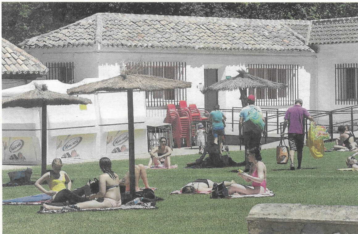
Bañistas en una piscina de la provincia, en una imagen de archivo.

El 29 de mayo, hasta 21 ayuntamientos de la zona de Talavera acordaron conjuntamente cerrar las piscinas en verano. Días después, 17 localidades de la Sierra de San Vicente hacían lo propio. Y ayer un total de 35 municipios de La Sagra y Torrijos suscribían la misma decisión. Se trataba de Alameda de la Sagra, Albarreal de Tajo, Añover de Tajo, Arcicóllar, Barcience, Bargas, Borox, Burujón, Cabañas de la Sagra, Camarena, Carranque, Casarrubios del Monte, Cedillo del Condado, Chozas de Canales, Cobija, Esquivias, Lominchar, La Torre de Esteban Hambrán, Magán, Maqueda, Mocejón, Novés, Numancia de la Sagra, Olías del Rey, Palomeque, Pantoja, Portillo, Re-