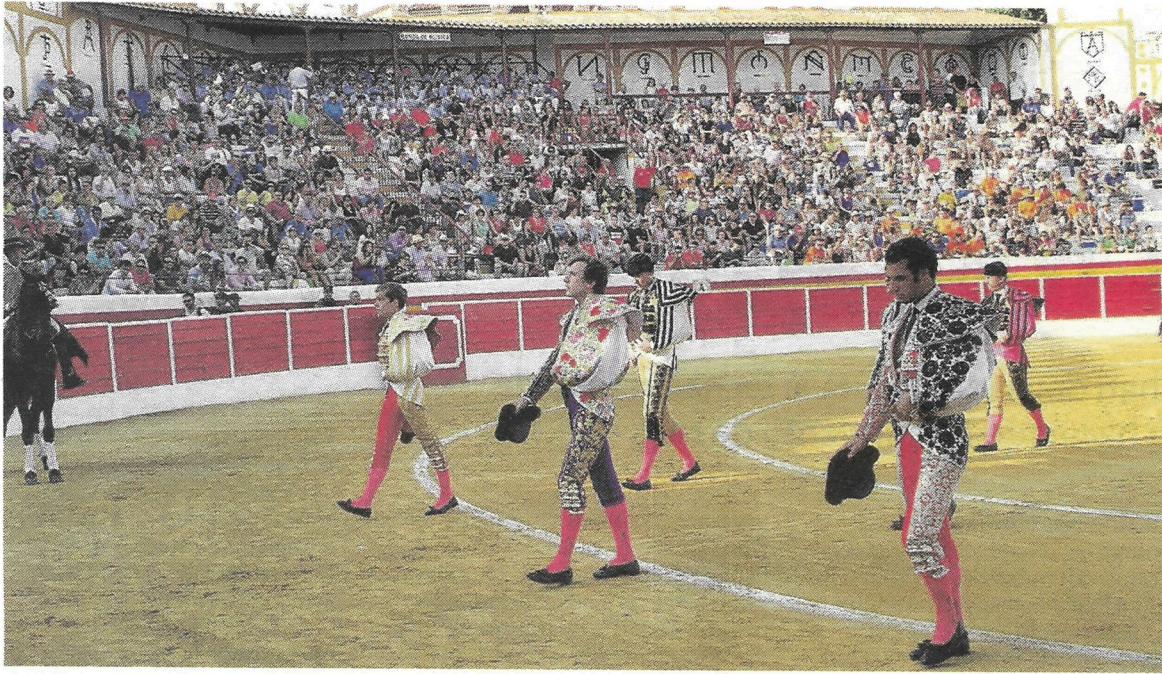
Añoover será una de las plazas de toros que abra sus puertas este año 2020. / DOMINGUÍN