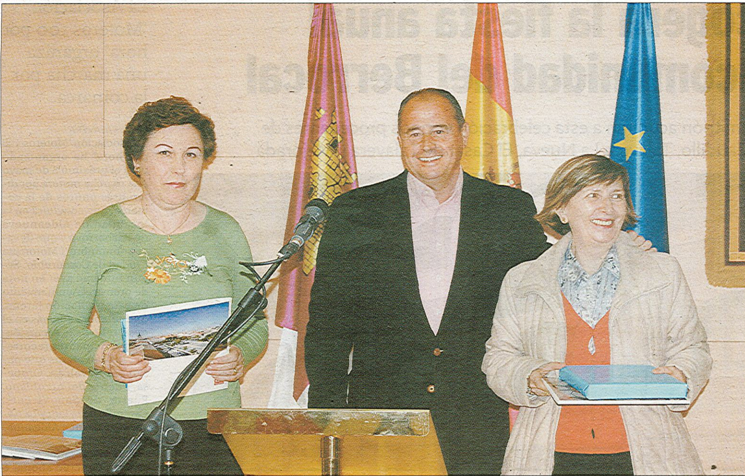
En la imagen la presentación del libro sobre la historia de Carranque.