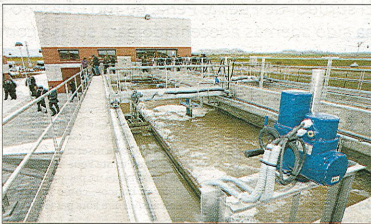
Esta depuradora da servicio a cinco poblaciones.

99,7 por ciento para el año que viene, frente al 78 por ciento actual. «Somos exigentes con el aprovechamiento del agua y la depuración es la mejor forma de predicar con el