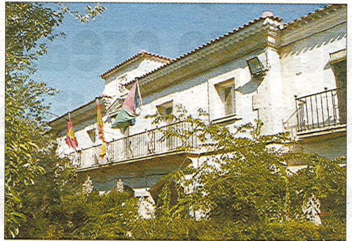
Ayuntamiento de Seseña. /R.C.

El Ayuntamiento de Seseña ya ha implicado activamente en dar a conocer a sus vecinos el crecimiento futuro del municipio.