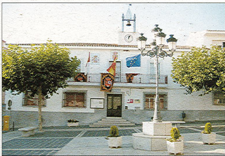
La historia del municipio ha sido recopilada de documentos varios durante meses.