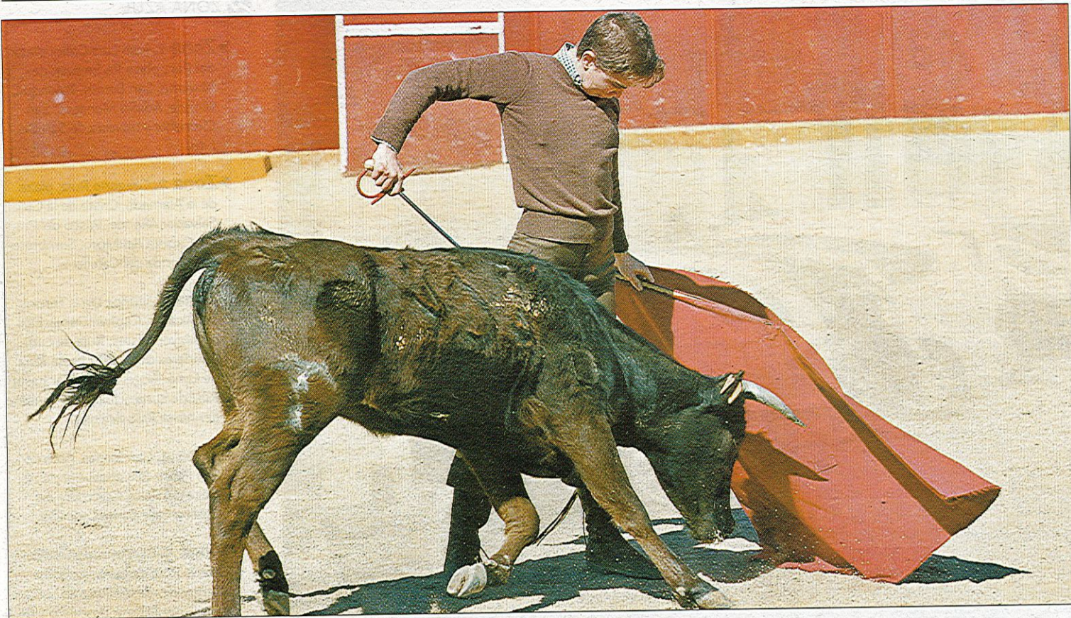
Los bolsines son una oportunidad para descubrir nuevos talentos en el Arte de Cúchares.