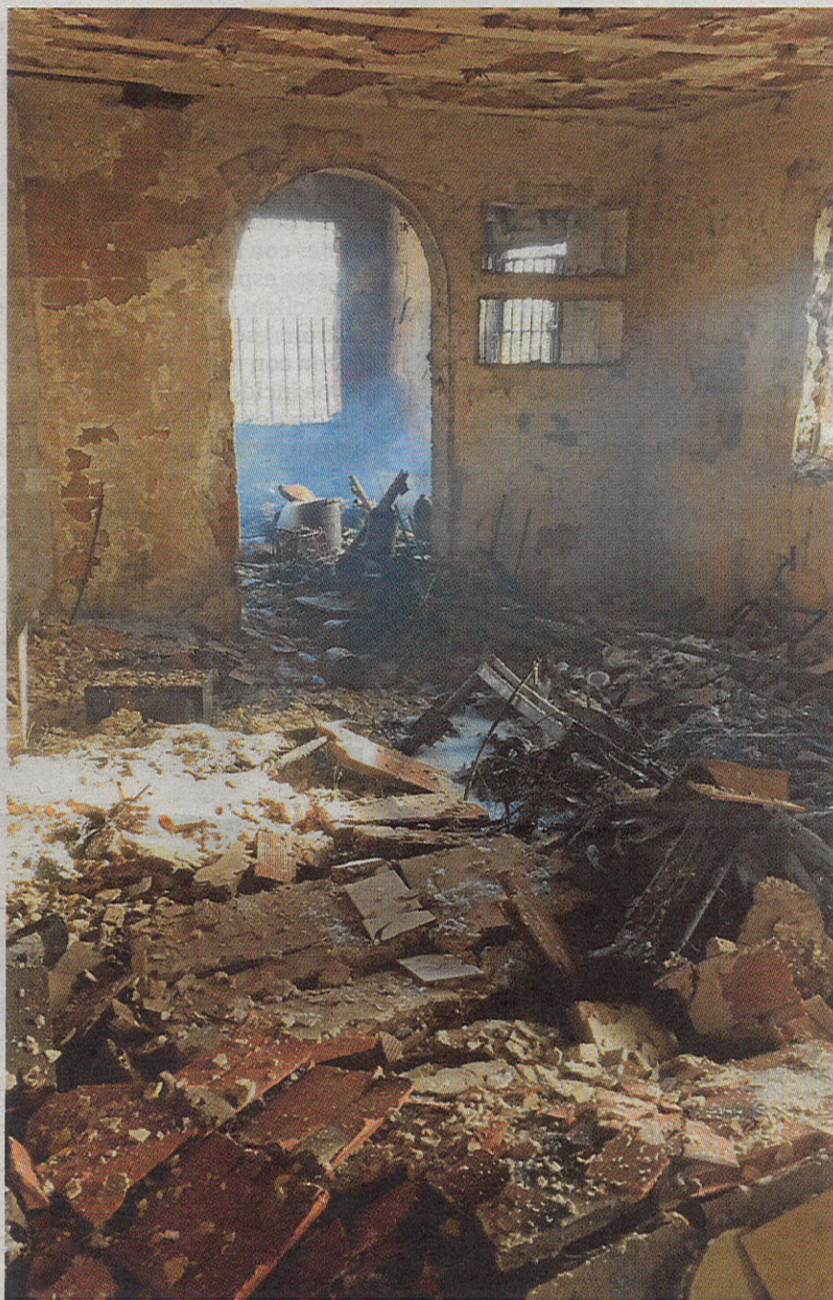
Interior del chalé después del pavoroso incendio

Para sofocar el incendio, la dotación de nueve bomberos empleó espuma, además de un camión con 4.000 litros de agua, una bomba nordriza, una autoescala y un vehículo de mando. En el interior de la vivienda hallaron mucha materia combustible y, en una habitación, localizaron almacenados numerosos botes de pin-