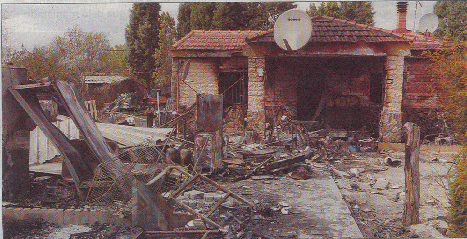
El incendio destruyó completamente el unifamiliar situado en la urbanización Nuevo Borox.