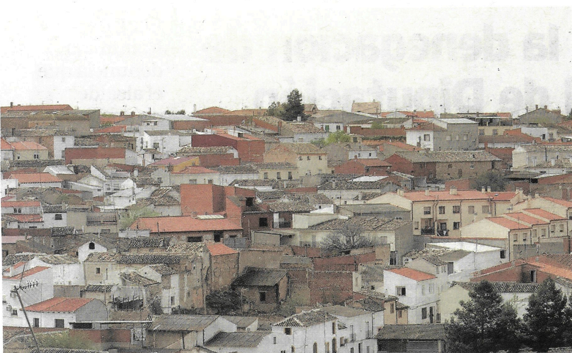
Núcleo urbano de Santa Cruz de la Zarza.

SANTA CRUZ DE LA ZARZA | DENUNCIAS DESDE EL MES DE DICIEMBRE