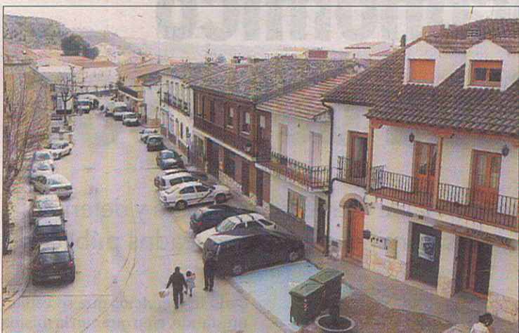
En el informe se señala que la Junta les debe 482.000 euros.

En este sentido, destacada el escrito, firmado por el propio primer edil, que más de la mitad de esta deuda (4.110.413 euros) corresponde a préstamos a largo plazo con diferentes entidades bancarias, un