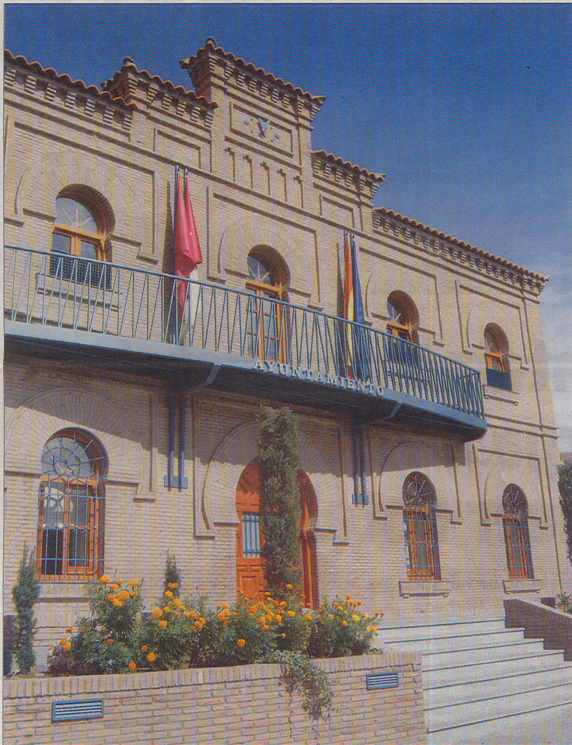
Los concejales deberán reunirse de nuevo para decidir si aprueban las nuevas ordenanzas del equipo de Gobierno.

Otro punto, que planteaba la modificación del crédito 2/212, se aprobó con los votos a favor de