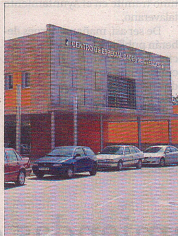
CEDT de Illescas.