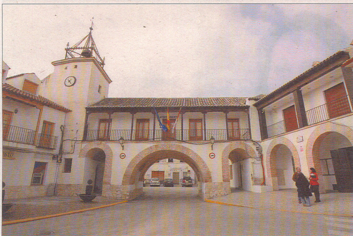
El Consistorio seguirá intentando cambiar la raquítica economía municipal con medidas austeras.