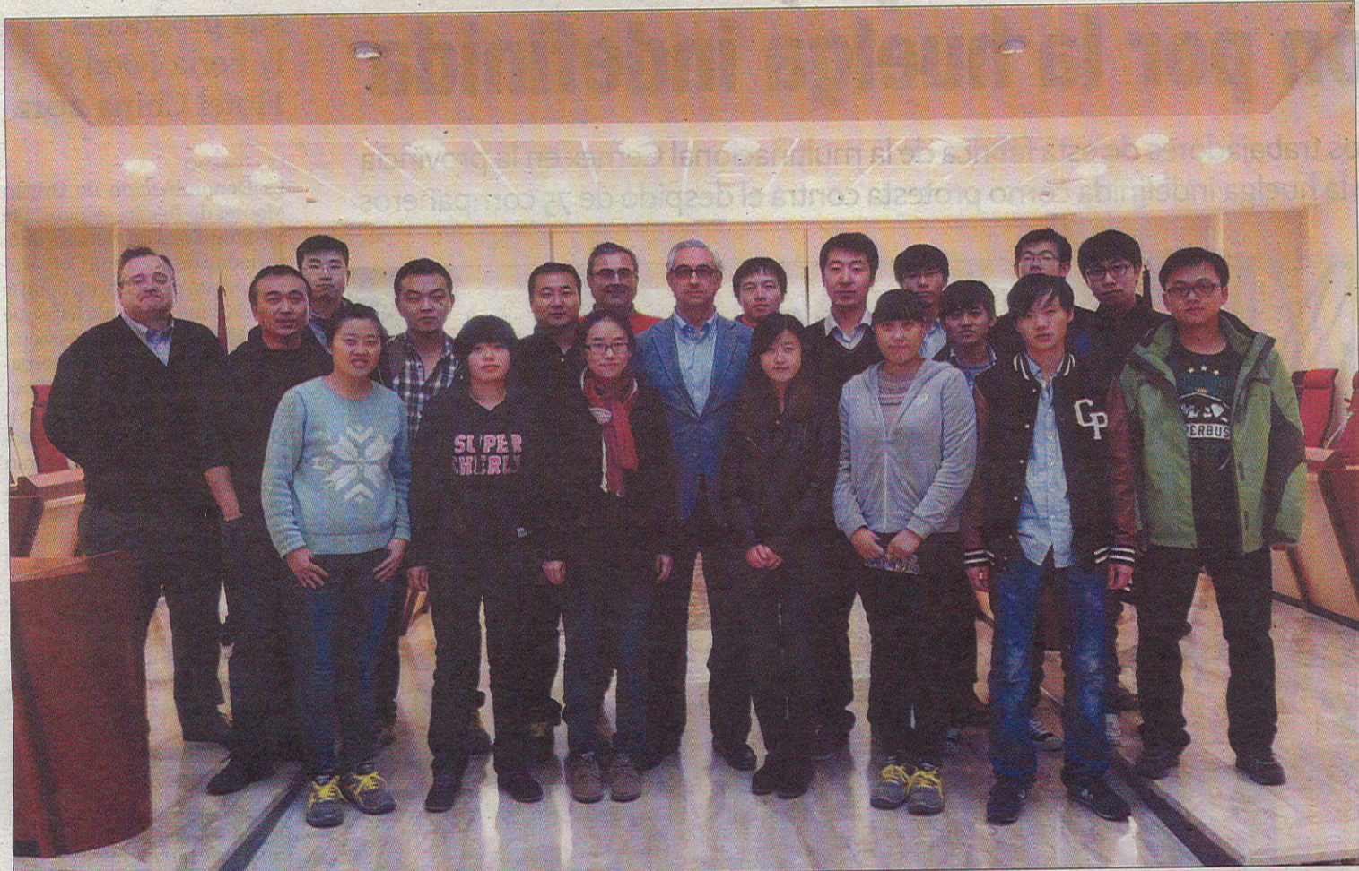
Ingenieros chinos han acudido estos días a Illescas para ampliar sus conocimientos. En la imagen, junto al alcalde de la localidad en el salón de plenos.