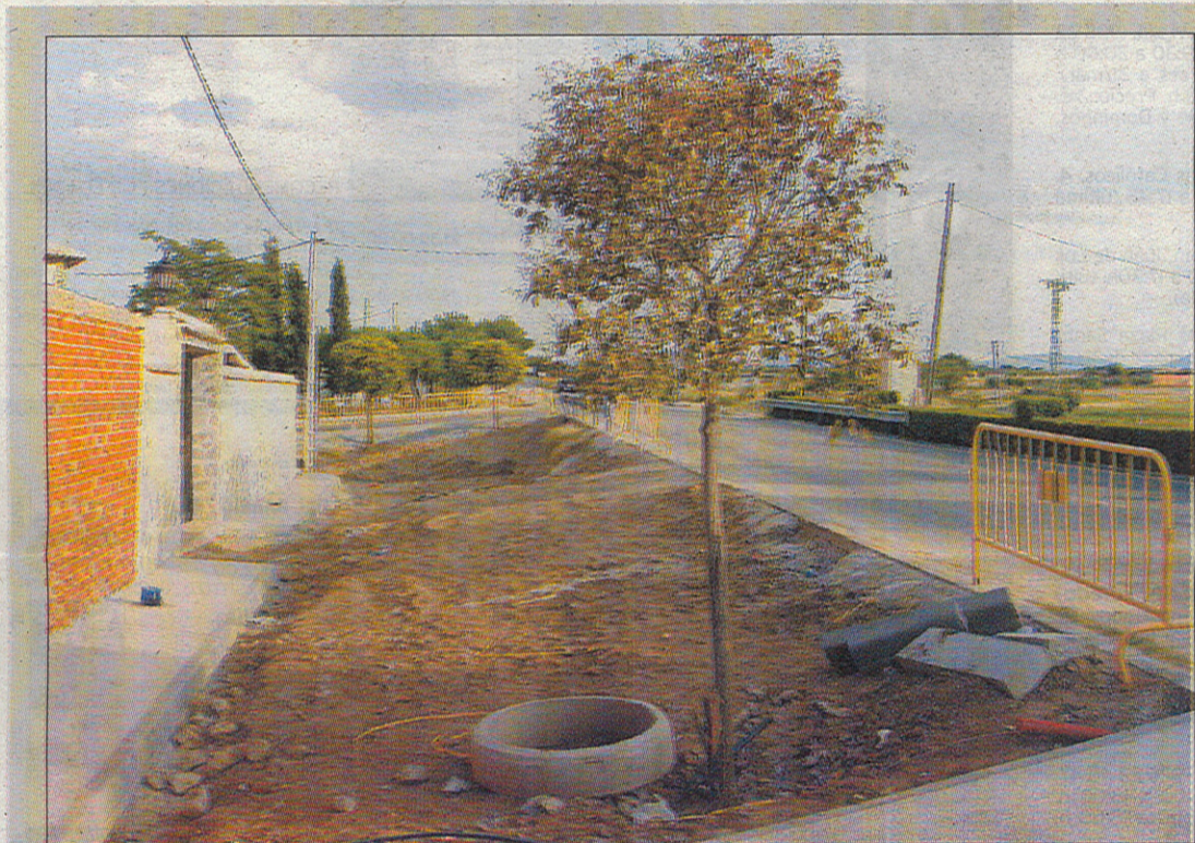
Este año los municipios sólo han aportado un cinco por ciento del montante total.