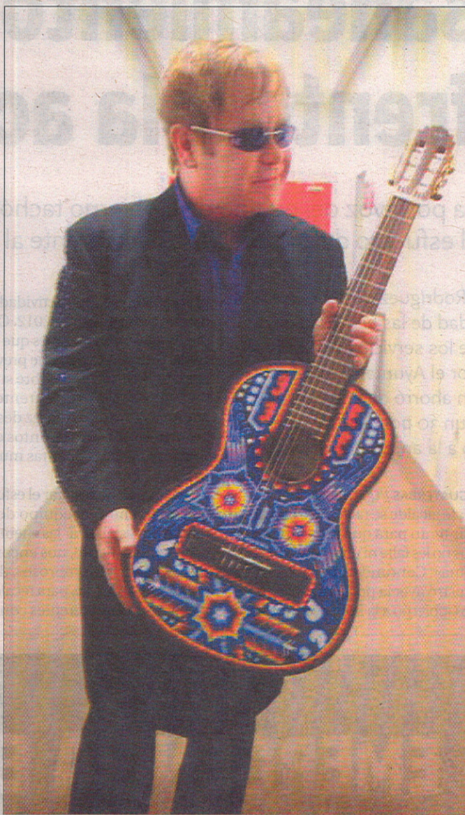
El músico britano luce su nueva guitarra 'made in' Esquivias. / LT

De dónde provienen las maderas únicas que dan forma a su cuerpo, de qué están hechas las cuerdas o cuánto se tarda en crear una guitarra clásica fueron algunos de los enigmas que se resolvieron a lo largo de los capítulos que se prolongaron en la cadena hasta el 19 de diciembre.