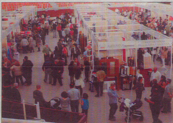
En la feria participarán comerciantes de multitud de sectores.

La Feria se celebrará en las instalaciones cedidas por la constructora local Grupo Menchero