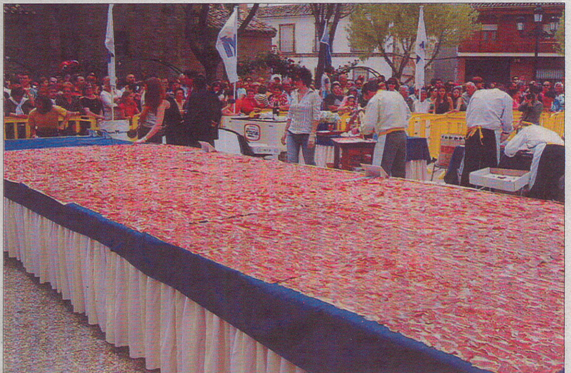
El último Récord del Plato de Jamón Cortado más grande del mundo lo tiene Borox./LT

Al tiempo, la Feria contará con un espacio de Hostelería donde los asistentes podrán descansar y tomar un refresco o aperitivo para recargar fuerzas y seguir disfrutando de sus compras.