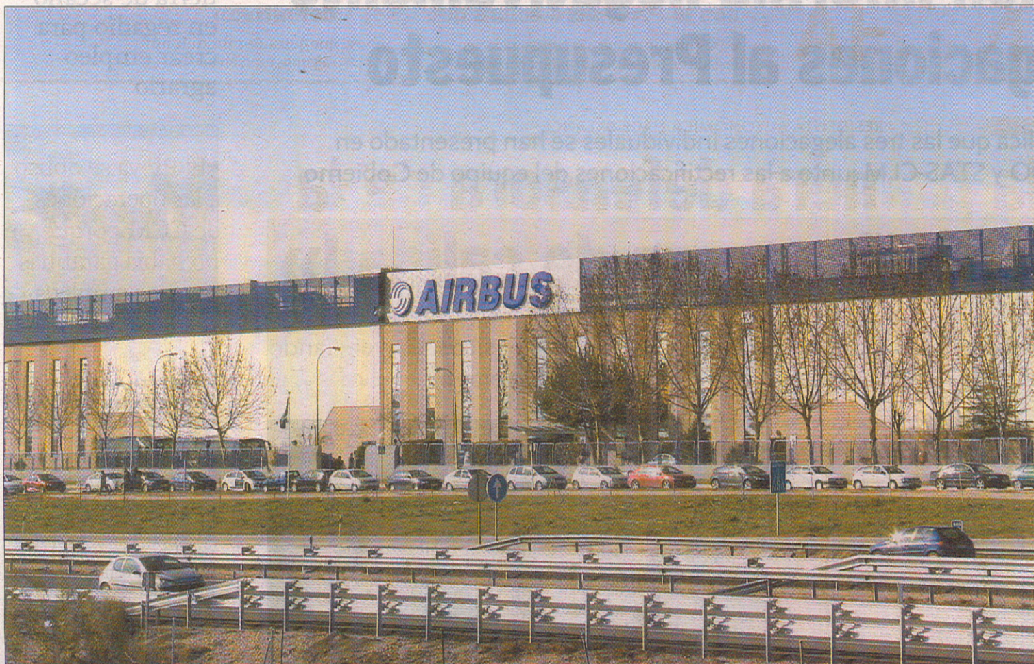
En el pasado pleno el concejal de IU solicitó que la empresa Airbus contrate a desempleados de la localidad.