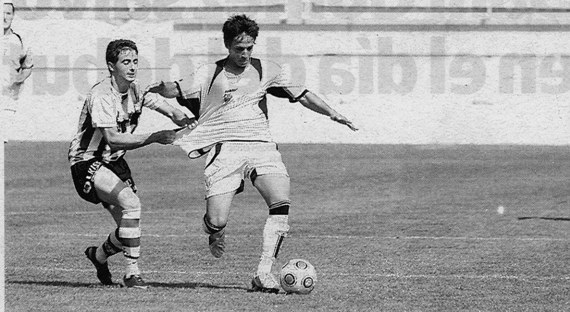
Lances del encuentro que enfrentó al Albacete B y al Quintanar ante la presencia de jugadores de La Gineta.