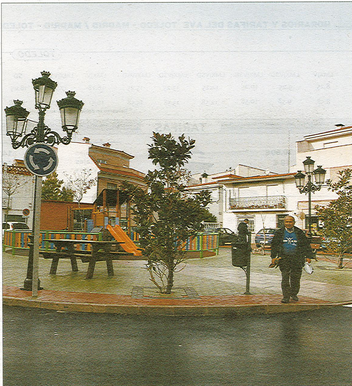
Numancia de la Sagra es el principal Ayuntamiento afectado por la suspensión de aportaciones del Estado.