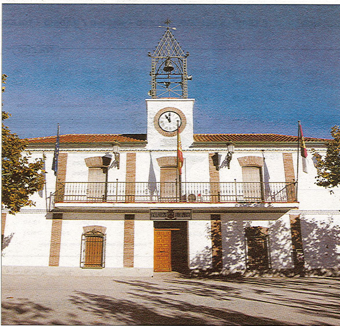
El Ayuntamiento intentará mantener su actividad con menos empleados, mientras otros van al paro por seis meses./D.P.

SE TRAMITA LA SEMANA PRÓXIMA. Torres añade que, cuando antes abone la Junta lo adeudado por diversos servicios conveniados con el Ayuntamiento -como el del Centro de Día, la Escuela Infantil y la Ayuda a Domicilio- antes volverá la normalidad laboral al Consistorio. De momento, se ha previsto que