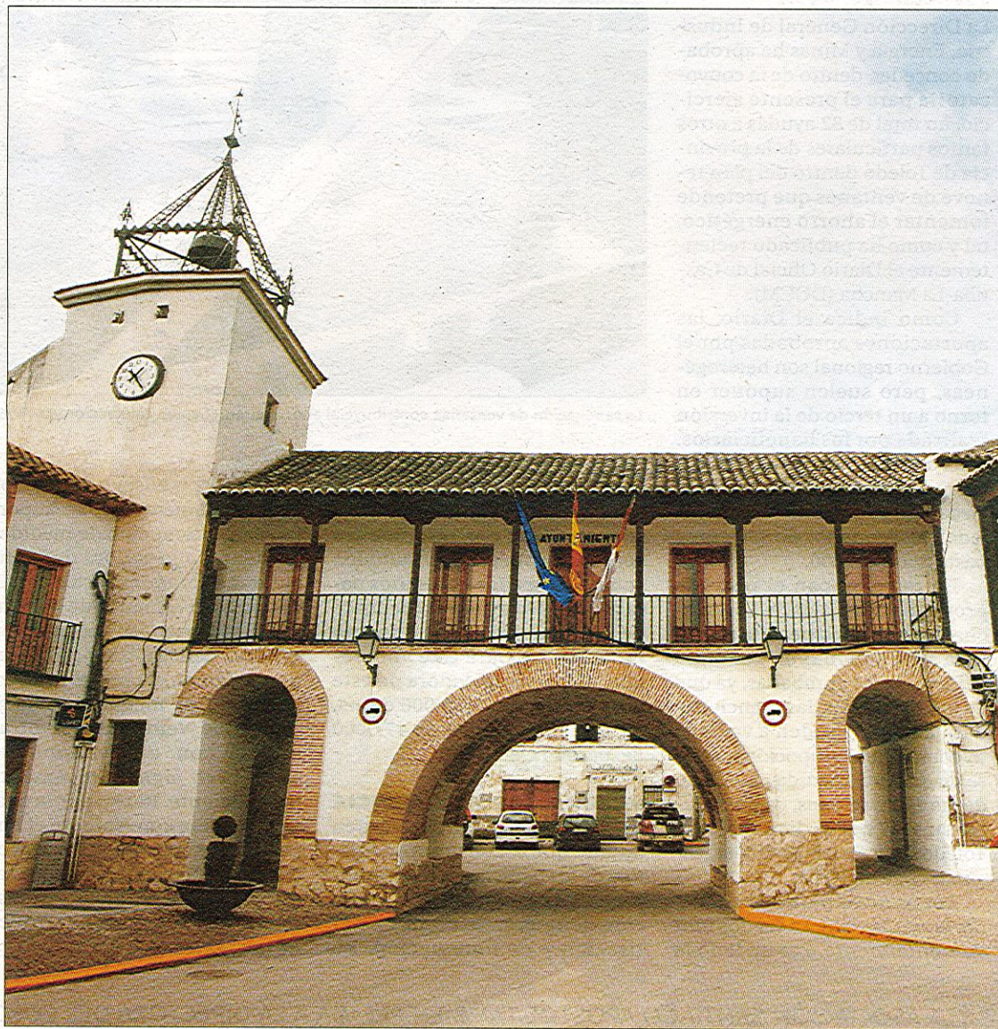
Han roto con una empresa mixta que creó el antiguo Gobierno con socios privados a la que se dieron «contratos supervalorados»

El nuevo equipo de Gobierno ha podido sacar adelante unos presupuestos para este año de 3,6 millones, frente a los 4,4 millones del ejercicio pasado. Este recorte del gasto se ha puesto en práctica sobre todo con la supresión de un servicio municipal que resultaba deficitario para el Consistorio, como es el del autobús urbano. En el pasado mandato, la entonces oposición del PP instó al PSOE a que procediera a su suspensión no ya por las pérdidas, sino porque tenía el conocimiento de que se había