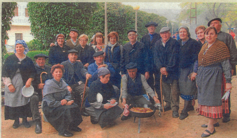
Paisanos ataviados para la ocasión durante el concurso gastronómico en el paseo Ortega Munilla