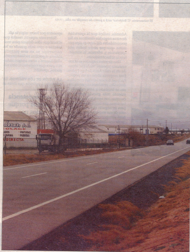
Polígono de Sonseca, en la carretera que comunica con Orgaz.

Asimismo, se quiere que desde la Institución provincial se asesore en cuanto a la forma de proceder para ir cumplimentan-