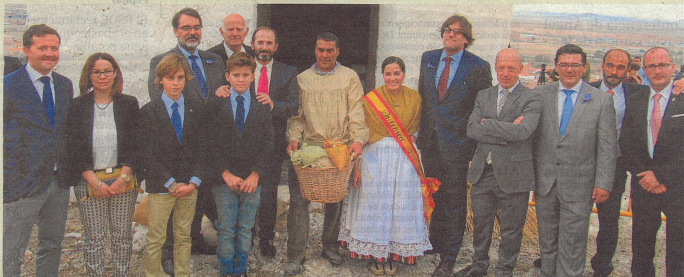
Autoridades que asistieron a la molienda de la paz