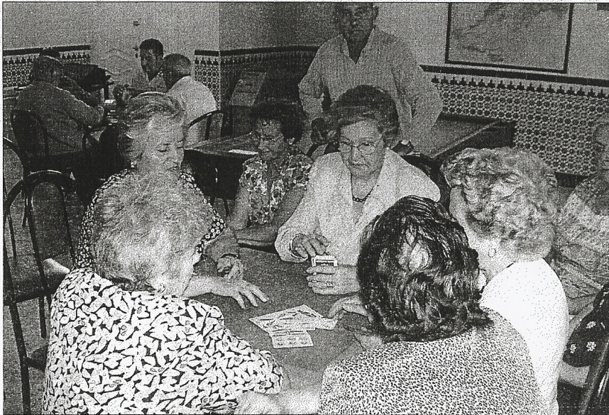
Los vecinos han disfrutado de lo lindo con las actividades programadas.

Todavía con el recuerdo del espectáculo pirotécnico en la retina, los residentes en la localidad asistieron al clásico encierro. Éste albergó una incidencia, la de la