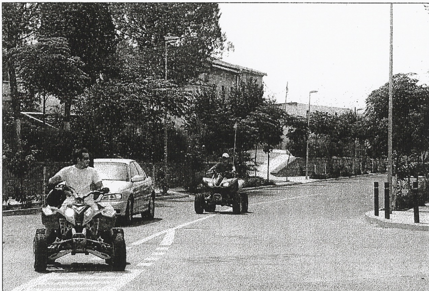
Las calles de la localidad tuvieron unos turismos muy especiales gracias a la exhibición de los quadshow.

Para el miércoles, sin olvidar que los niños dan un color especial a este tipo de días, los paya-