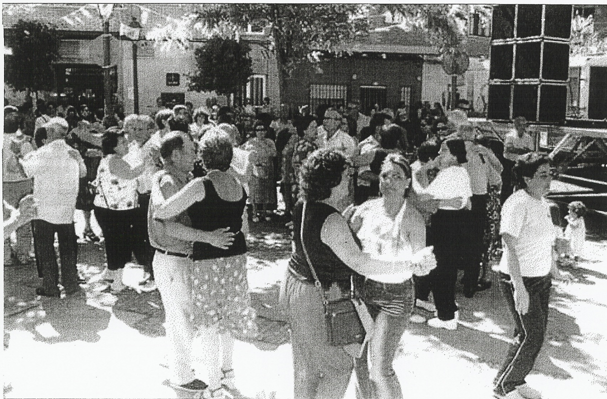
Grandes y pequeños han disfrutado las fiestas con intensidad.