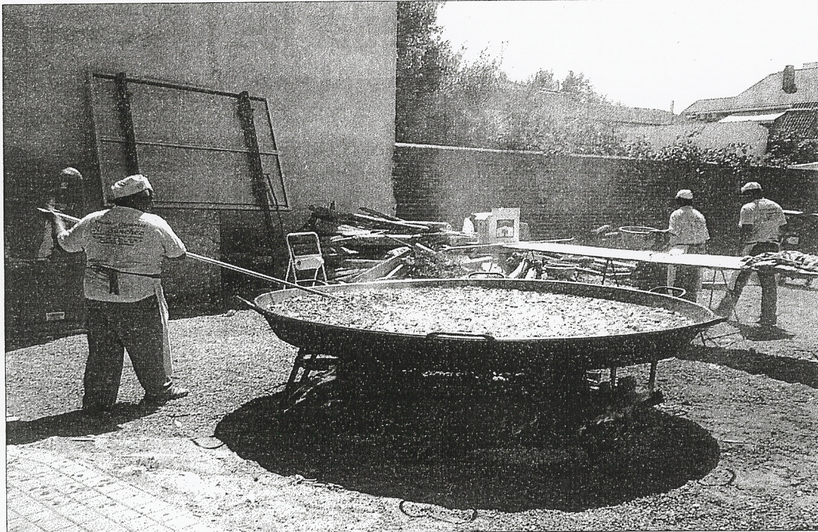
Una paella gigante para invitar a los vecinos.