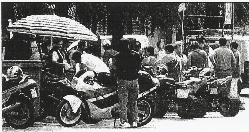
El rugido de las motos fue uno de los protagonistas de la jornada del sábado.

sos actuarán en el casco urbano. La devoción se enfocará en la Iglesia con las confesiones para clausurar otra vez la fiesta con verbena.