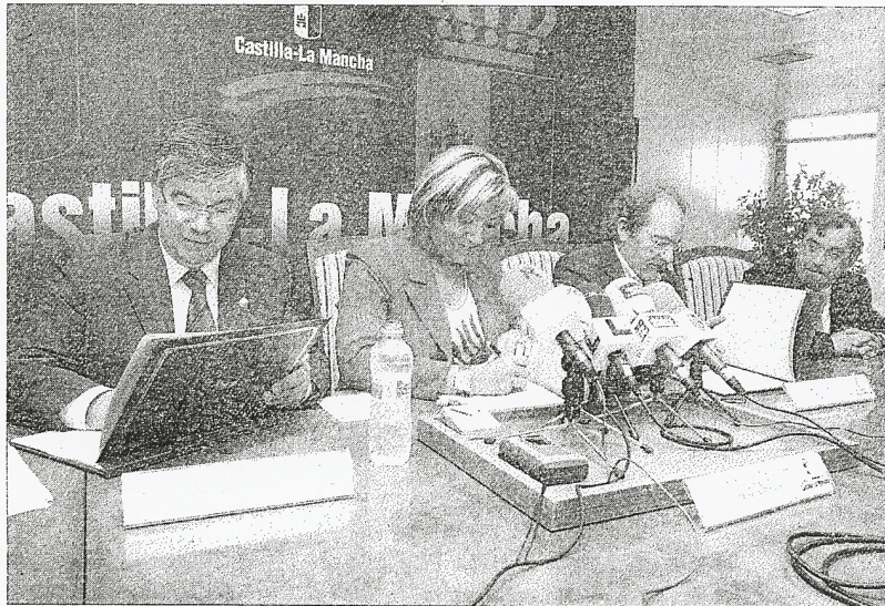
El convenio afectará a 37 municipios en toda la provincia de Toledo.

La firma de este convenio, que afecta a un total de 37 municipios que representan casi el 51 por ciento de la población la provincia, plantea los siguientes objetivos: «implantar la Agenda Local 21; realizar un diagnóstico de los municipios como una herramienta de gestión en la consecución de la sostenibilidad y colaborar en los procesos de dinamización social y de participación pública». Además, se buscará fomentar la sensibilización y respeto hacia el Medio Ambiente entre los responsables municipales y facilitar un intercambio entre todos los ayuntamientos que participan en la Red de Ciudades Sostenibles de la provincia. Para ello, se contará con una financiación de 120.000 euros de los que la Consejería aportará el 50 por ciento y la Diputación el otro 50», explicó Arévalo argumentando que «la vida humana en nuestro planeta no puede ser sostenible sin unas comunidades locales viables desde el punto de vista económico, social y ambiental», y destacó que «es muy