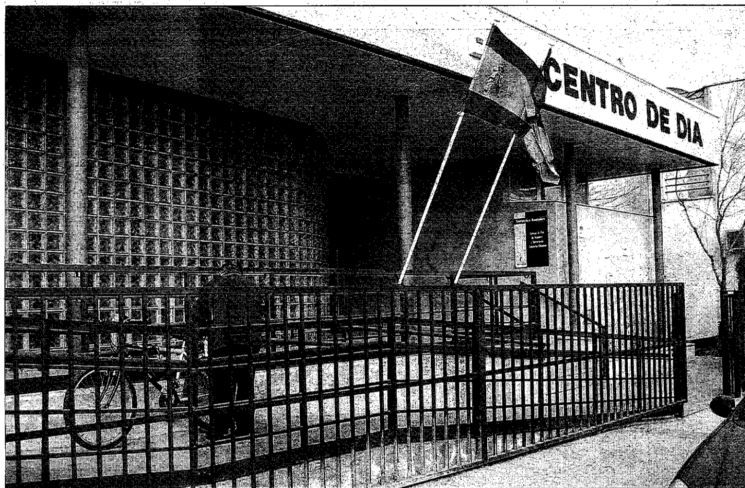
Según el director, los mayores que acuden al Centro destacan por su capacidad de participación en todas las iniciativas que se programan. / R.C.