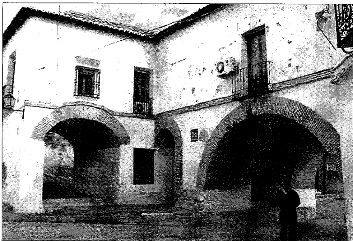
Marejada municipal en Borox con los servicios médicos de fondo.