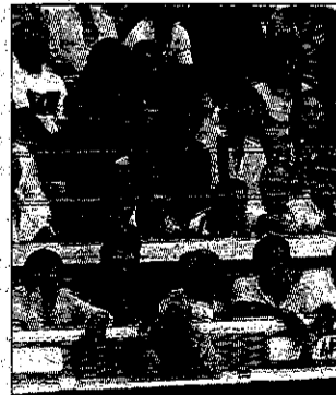
Buen orden en la plaza.

fotógrafos, prensa acreditada que hubo en la corrida, todo ello gracias a la actuación y control de la Guardia Civil.