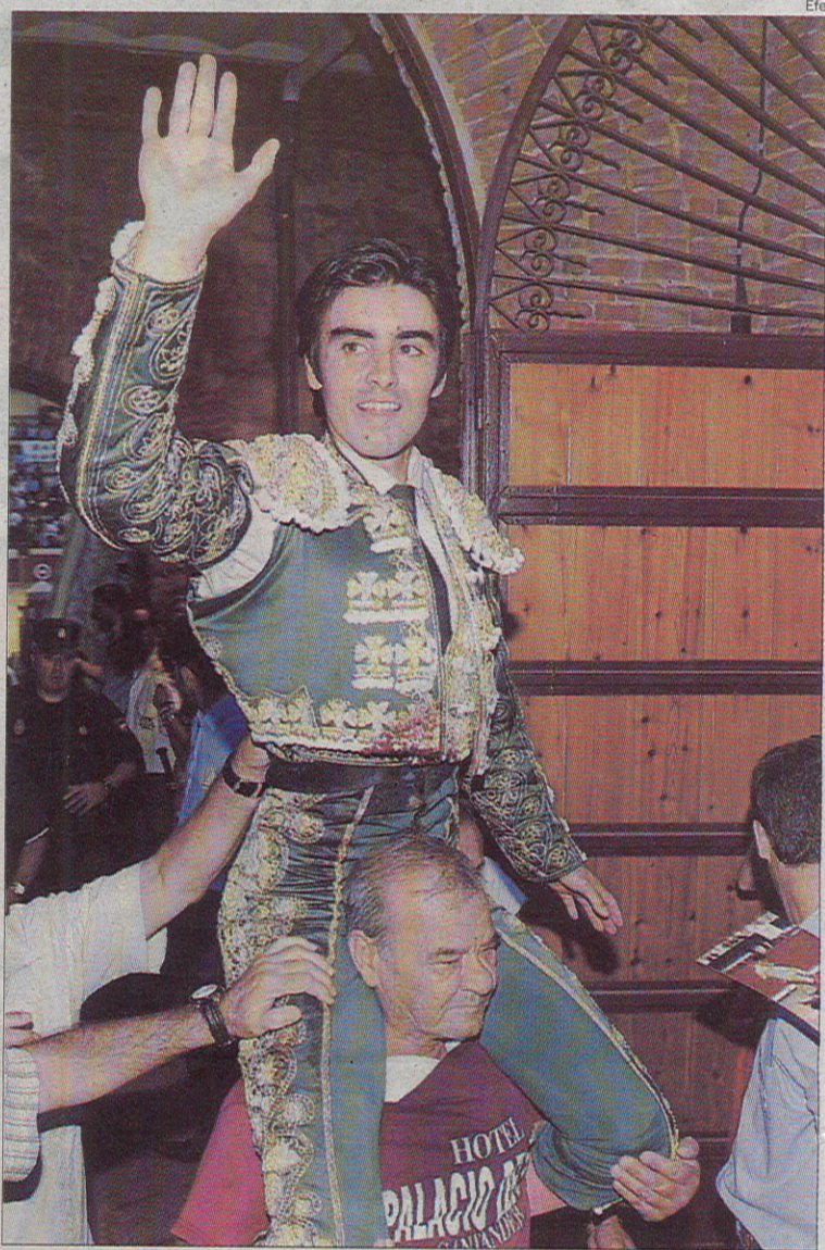
El diestro extremeño salió a hombros del coso vallisoletano