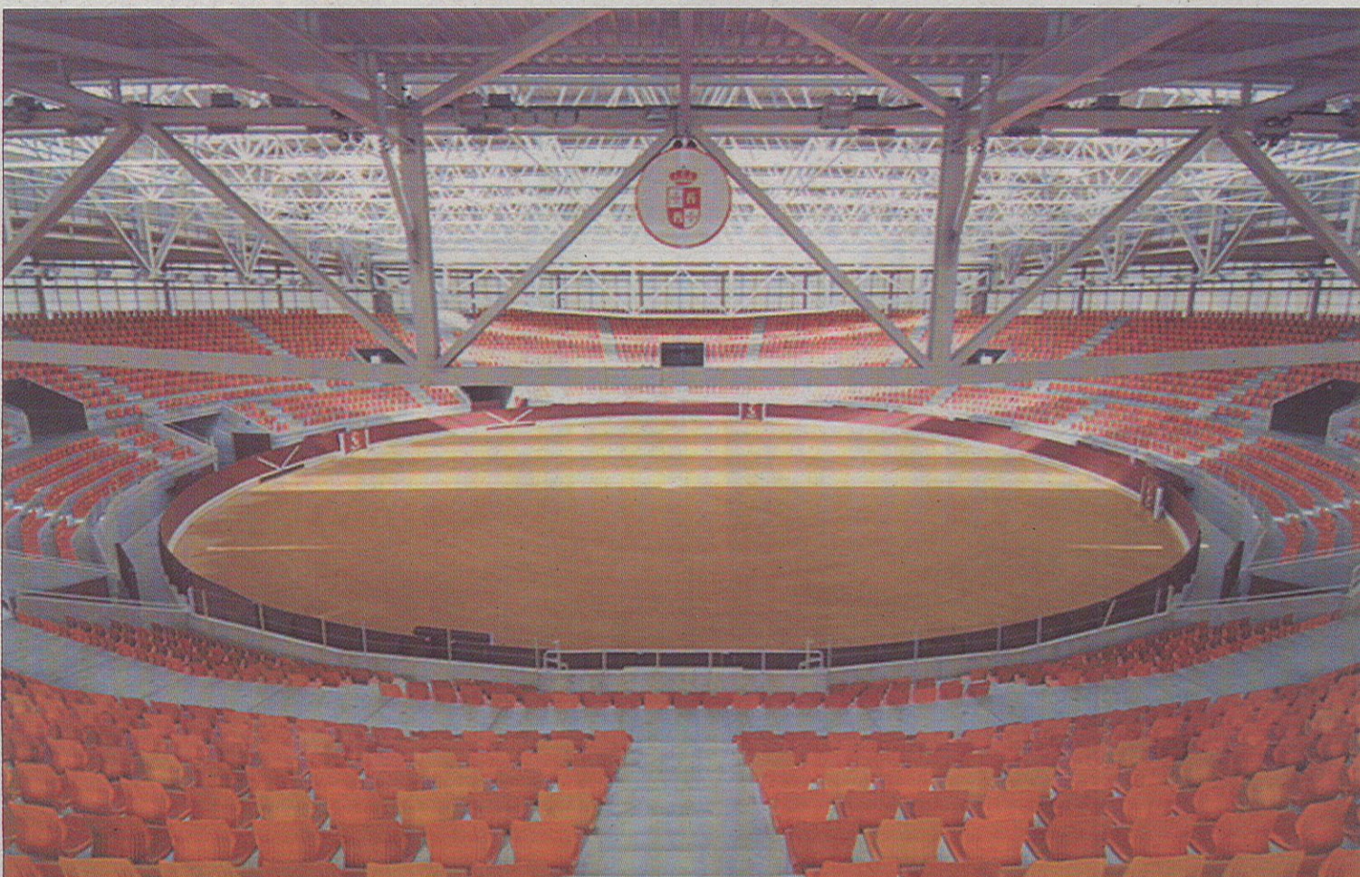
El espectáculo se celebrará en la plaza de toros cubierta de Illescas.