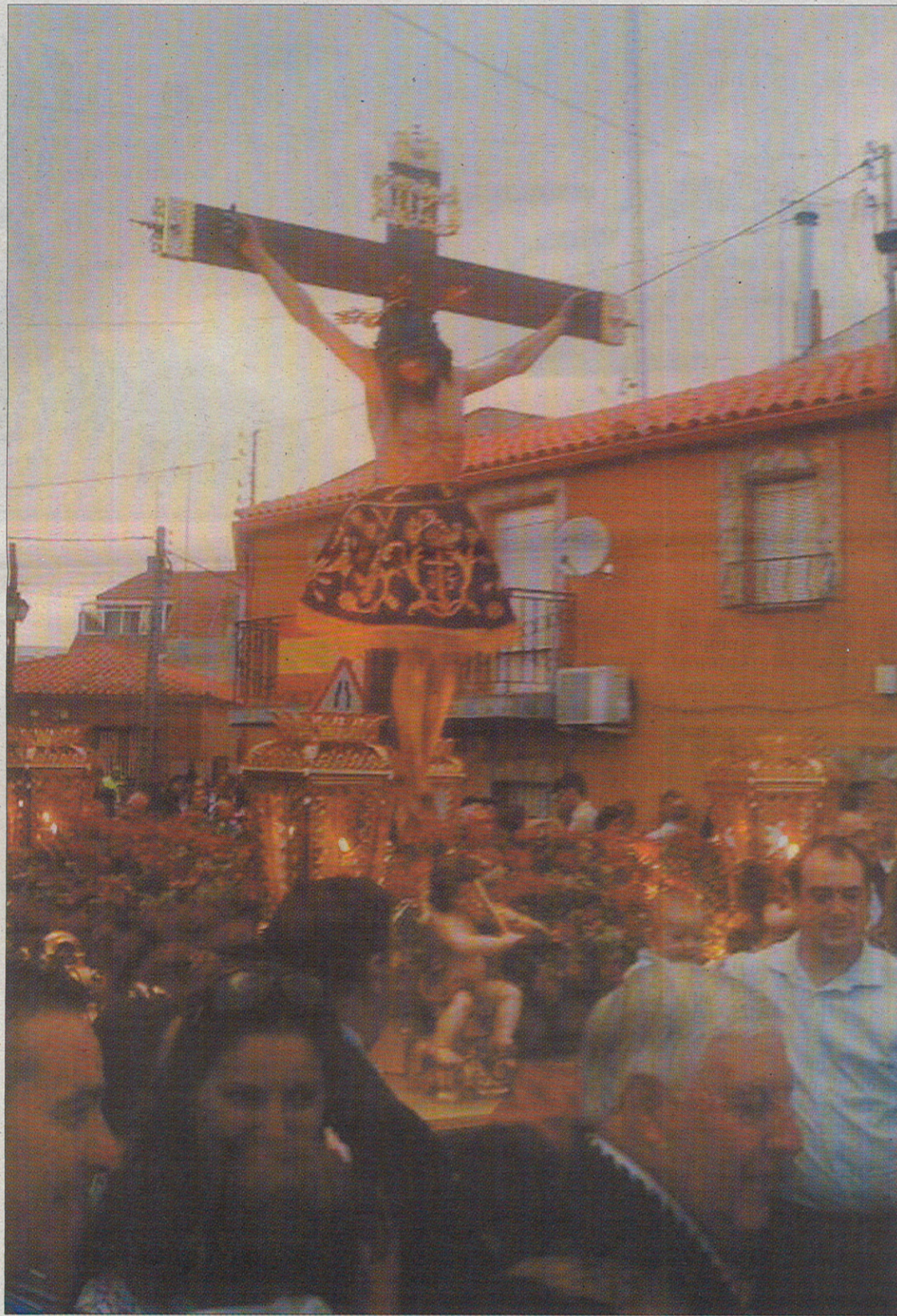
El domingo fue el día en el que el santo procesionó por las calles del municipio.