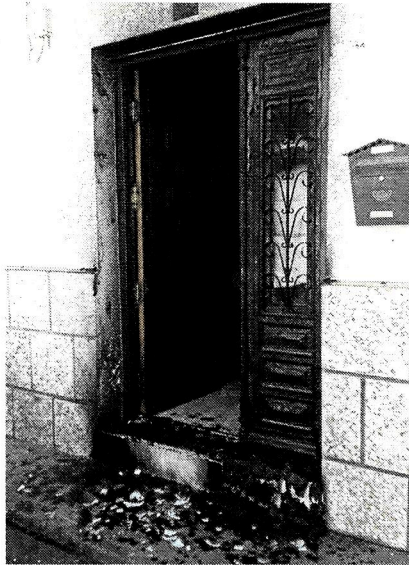
Estado en el que quedó la entrada a una vivienda de la calle Picota tras ser quemada por los okupas