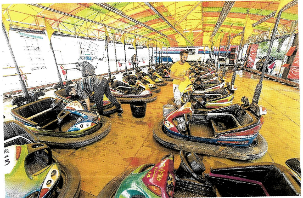
Dos trabajadores se esmeran para devolver la limpieza a una de las atracciones, ayer en Mora.