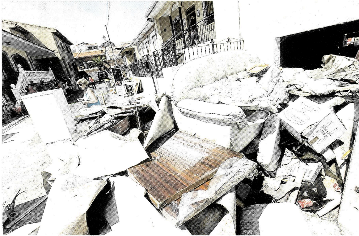
Enseres rescatados de un sótano después de la inundación en una casa de Borox.

Los afectados deben entregar en el Ayuntamiento de Borox el formulario disponible en la página de Internet 'www.ayuntamientodeborox.com' para optar a las ayudas públicas. En este sentido, hay tres documentos que pueden ser abier-