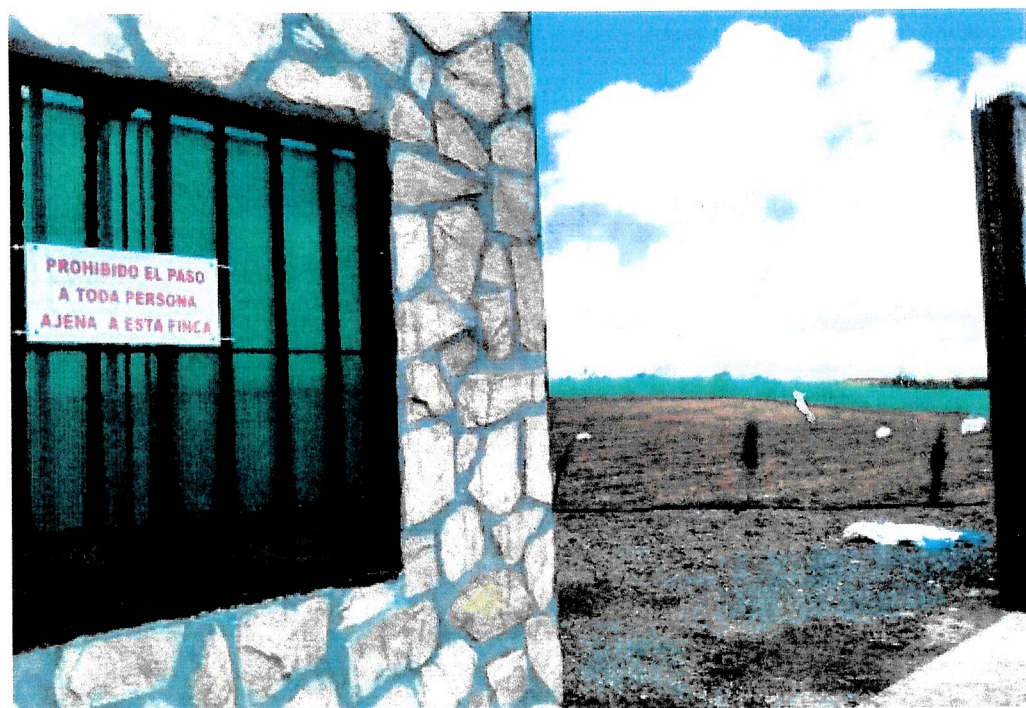
Entrada a la finca. Al fondo, la parcela limpia después de que el tractor quitase la marihuana -

Responden por esta megaplantación la administradora y el dueño de la finca, que son pareja sentimental y que tenían a un trabajador viviendo en la explotación. El empleado cuidaba de las plantas y realizaba también funciones de guardián de las instalaciones, aunque hay videovigilancia, según otras fuentes consultadas por ABC.