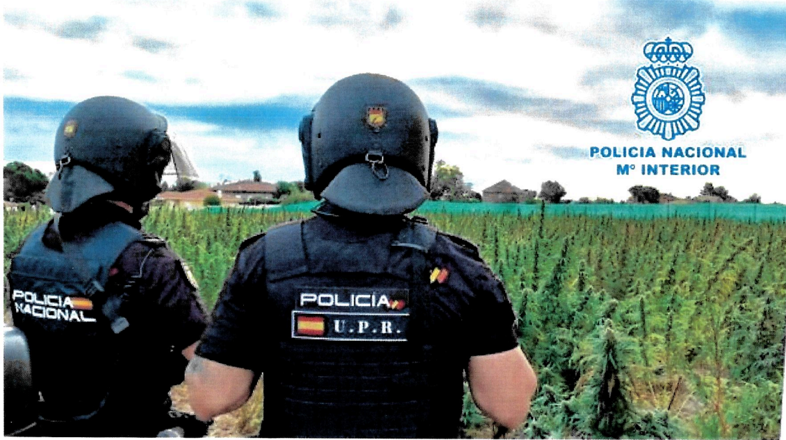
La Policía, en la plantación de Borox

La colaboración ciudadana jugó un importante papel en las operaciones